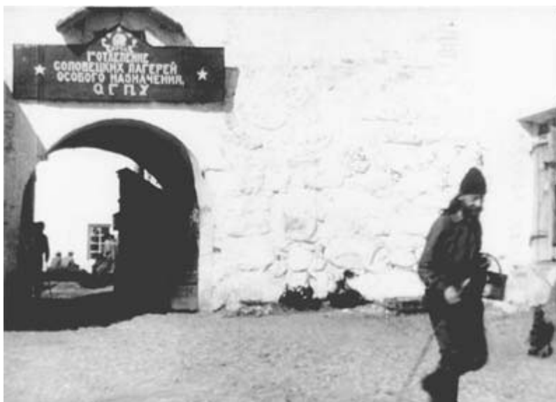
Соловецкий концлагерь. 1929 год

По воспоминаниям современников, Секирная гора представляла собой подобие внутренней тюрьмы с самым суровым режимом. Кормили там гнилыми продуктами и то в самом малом количестве. На Секирной горе было два отделения – верхнее и нижнее. Целыми днями заключенные верхнего отделения должны были сидеть на жердочках, не доставая ногами до пола, вплотную друг к другу. На ночь разрешалось лечь на голом каменном полу, и не давали ничего, чем можно было бы укрыться. Заключенных было столько, что спать приходилось всю ночь на одном боку. В зимние месяцы это превращалось в пытку, так как окна в камере были разбиты. Через некоторое время заключенных из верхнего отделения переводили в нижнее и тогда позволяли работать, но работу давали самую тяжелую.