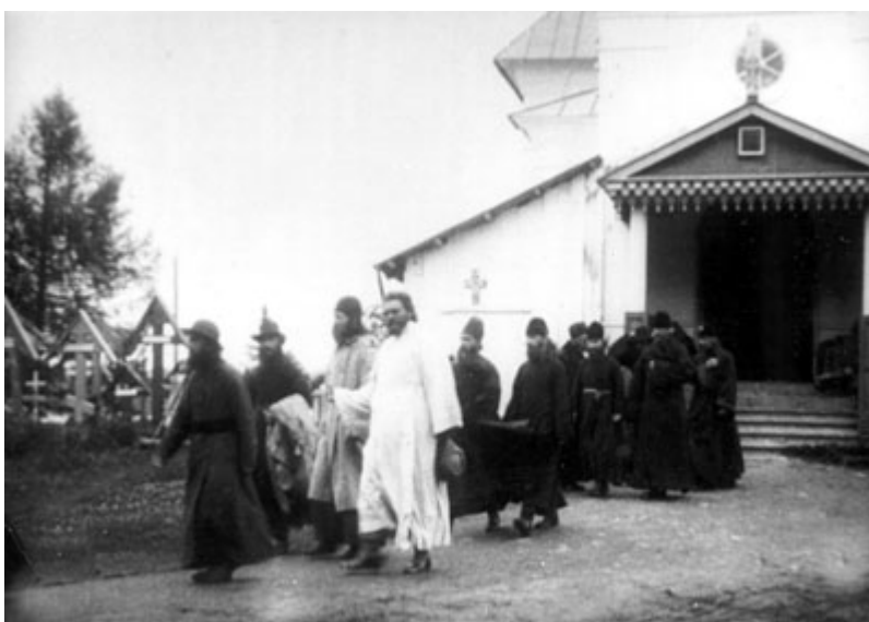
Соловецкий концлагерь. Храм преподобного Онуфрия Великого. 1929 год

К вышеизложенному считаю необходимым добавить нижеследующее. В посещении вольных монахов я не считаю себя виновным. В 1928 году, когда я прибыл в поселок Кремль, мы, заключенное духовенство, не только имели полное общение с вольными монахами в храме, но и невозбранно ходили к ним на квартиры и даже дневалили в их квартире. Сам я в продолжение некоторого времени дневалил в их помещении. Бóльшую часть 1929 и 30-го годов я провел на острове Анзере и, когда после длинного перерыва пришел в Кремль, то узнал, что пять монахов живут в часовне и подле них нет даже дневального; отсюда я понял, что и вход к ним не возбранен, тем более что никто и никогда не объявлял мне запрет на встречу с вольными монахами. К тому же мне было известно, что все они работают вместе с заключенными и потому находятся в непрерывном с ними общении.