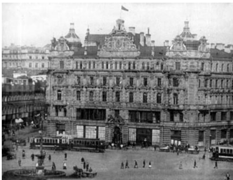
Лубянская площадь. Здание ОГПУ. Фото 1929 года