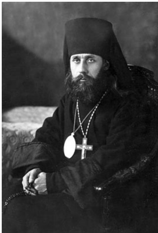
Аркадий, епископ Лубенский, викарий Полтавской епархии