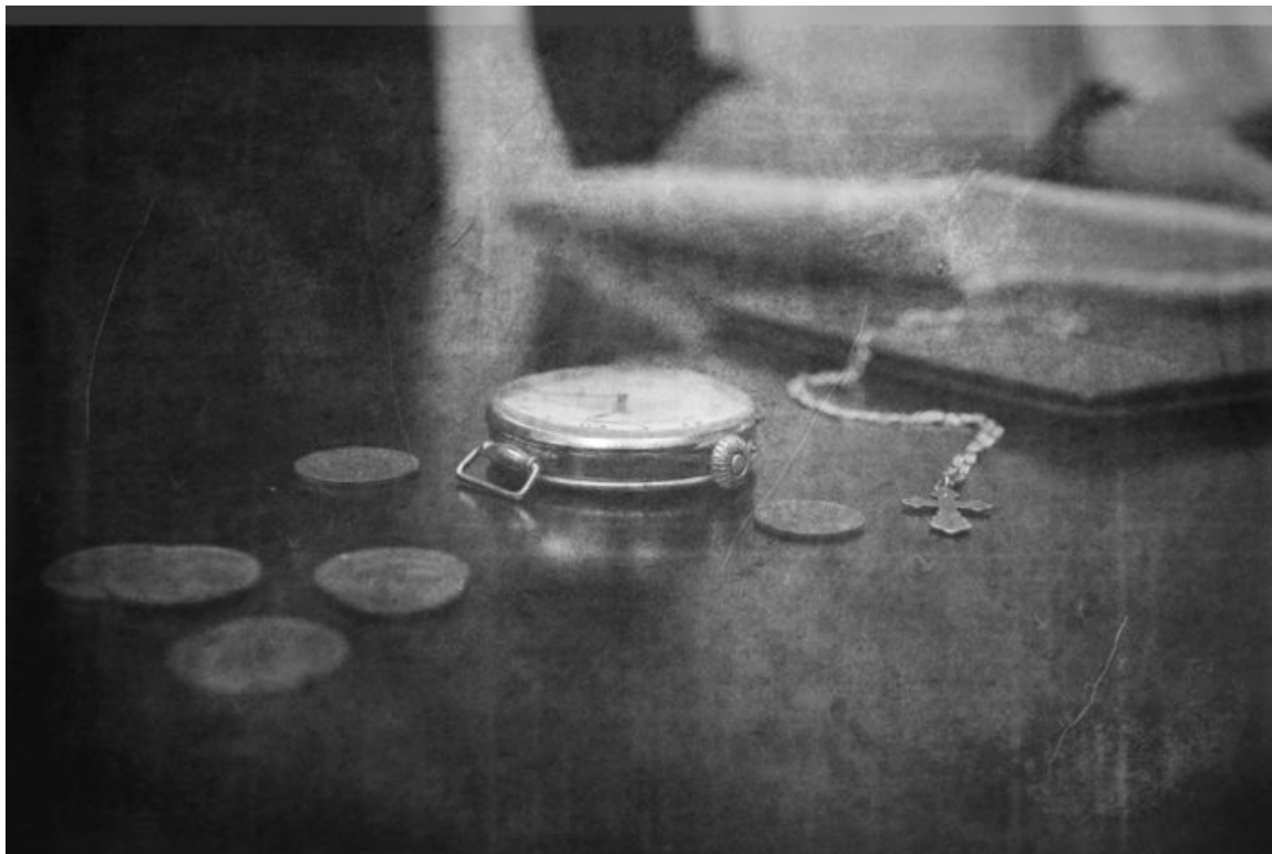
Взятые у священника во время обыска вещи следствию ничего не дали. Но приговор все же был вынесен однозначный

В 1929 году начался очередной этап гонений на Русскую Православную Церковь. Из центральных областей России стали высылаться на север духовенство и крестьяне, и Архангельск заполнился толпами ссыльных. Власти в Архангельске в соответствии с распоряжениями коммунистического правительства приступили к закрытию храмов в городе и области.