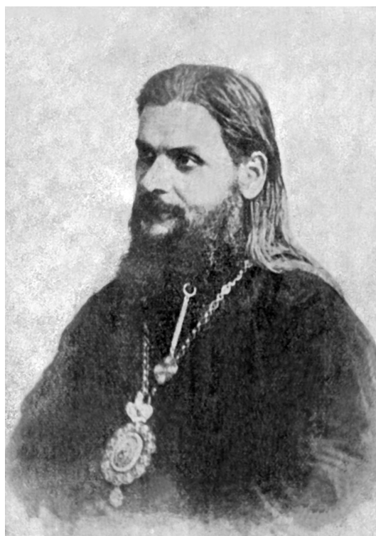
Гермоген, епископ Саратовский и Царицынский

им столовых духовно-просветительского отдела Братства Святого Креста. Как богослужения церковные, так и внебогослужebные собеседования всегда оканчивались раздачей народу листов и брошюр религиозно-нравственного содержания. Печатному слову епископ придавал особое значение в борьбе с врагами Церкви. В противовес литературе отрицательной, безбожной, противоцерковной, в миллионах экземплярах брошюр и листов распространяемой среди народа врагами Церкви и государства, владыка раздавал литературу положительную и обличительную. С этой целью он преобразовал и расширил епархиальный печатный орган – «Саратовский духовный вестник» и учредил еженедельный «Братский листок»; еженедельные печатные издания по его благословию и при его поддержке появились в Балашове, Камышине и Царицыне.