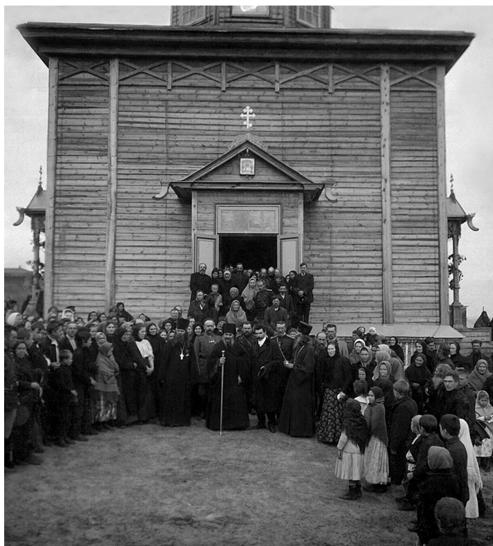
После освящения церкви в Саратове

Обращено владыкою особенное внимание на благоустройство и умножение монастырей в епархии, скитов, пúстыней, – этих, по его словам, живоносных источников, к коим с сердечною верою прибегают все скорбящие, озлобленные, отягощенные житейскими невзгодами и нуждами люди... За исключением города Камышина все города Саратовской епархии, благодаря трудам и деятельному участию и поддержке – не только нравственной, но и материальной со стороны Преосвященного владыки Гермогена, имеют или будут иметь свои обители или подворья, каковые уже и теперь доставляют утешение, отраду, духовное успокоение и спасение верующему и благочестивому народу русскому...»