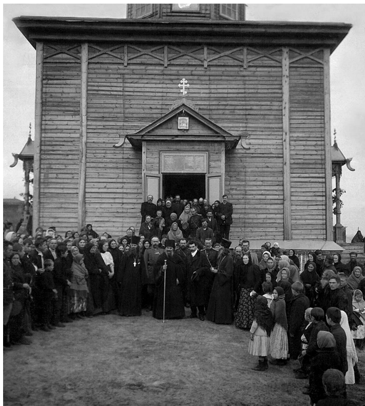
После освящения церкви в Саратове

Обращено владыкою особенное внимание на благоустройство и умножение монастырей в епархии, скитов, пúстыней, – этих, по его словам, живоносных источников, к коим с сердечною верою прибегают все скорбящие, озлобленные, отягощенные житейскими невзгодами и нуждами люди... За исключением города Камышина все города Саратовской епархии, благодаря трудам и деятельному участию и поддержке – не только нравственной, но и материальной со стороны Преосвященного владыки Гермогена, имеют или будут иметь свои обители или подворья, каковые уже и теперь доставляют утешение, отраду, духовное успокоение и спасение верующему и благочестивому народу русскому...» 95