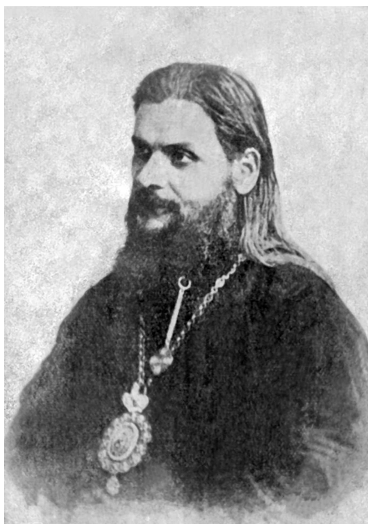
Гермоген, епископ Саратовский и Царицынский

им столовых духовно-просветительского отдела Братства Святого Креста. Как богослужения церковные, так и внебогослужebные собеседования всегда оканчивались раздачей народу листков и брошюр религиозно-нравственного содержания. Печатному слову епископ придавал особое значение в борьбе с врагами Церкви. В противовес литературе отрицательной, безбожной, противоцерковной, в миллионах экземплярах брошюр и листков распространяемой среди народа врагами Церкви и государства, владыка раздавал литературу положительную и обличительную. С этой целью он преобразовал и расширил епархиальный печатный орган – «Саратовский духовный вестник» и учредил еженедельный «Братский листок»; еженедельные печатные издания по его благословию и при его поддержке появились в Балашове, Камышине и Царицыне.