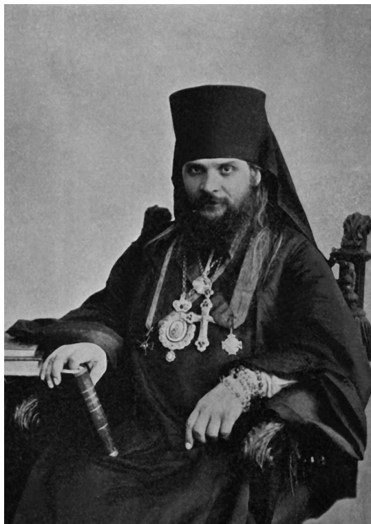
Епископ Гермоген (Долганев). 1904 год

и праздничных дней, владыка служил вечером по средам и пятницам. Во многих саратовских храмах Преосвященным Гермогеном было введено общенародное пение. В особо исключительных и важных случаях общественной и государственной жизни России владыка устраивал в Саратове и уездных городах и многонаселенных поселках ночные службы – с крестными ходами по городу и селениям, общим пением всех молящихся и поучениями проповедников. Для соблюдения порядка в крестных ходах им было учреждено при кафедральном соборе общество хоругвеносцев.