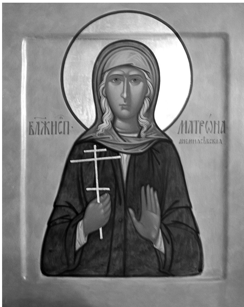
Блаженная исповедница Матрона Анемнясевская