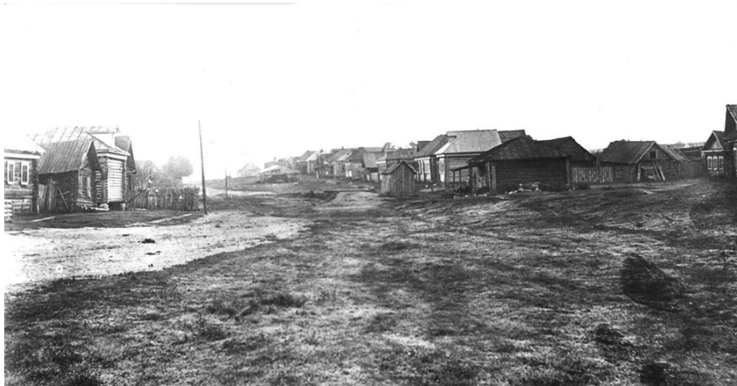
Деревня Анемнясево. 1933 год

Она очень скорбела, что несоблюдение постов становилось все более повсеместным и привычным явлением современной ей жизни и людьми даже не почиталось за грех. «Беззаконники сознают, что совершают беззаконие, – говорила она, – а кто постов не соблюдает, тот даже не сознает, что он грешит». К таким Матрона относилась с большой настороженностью.