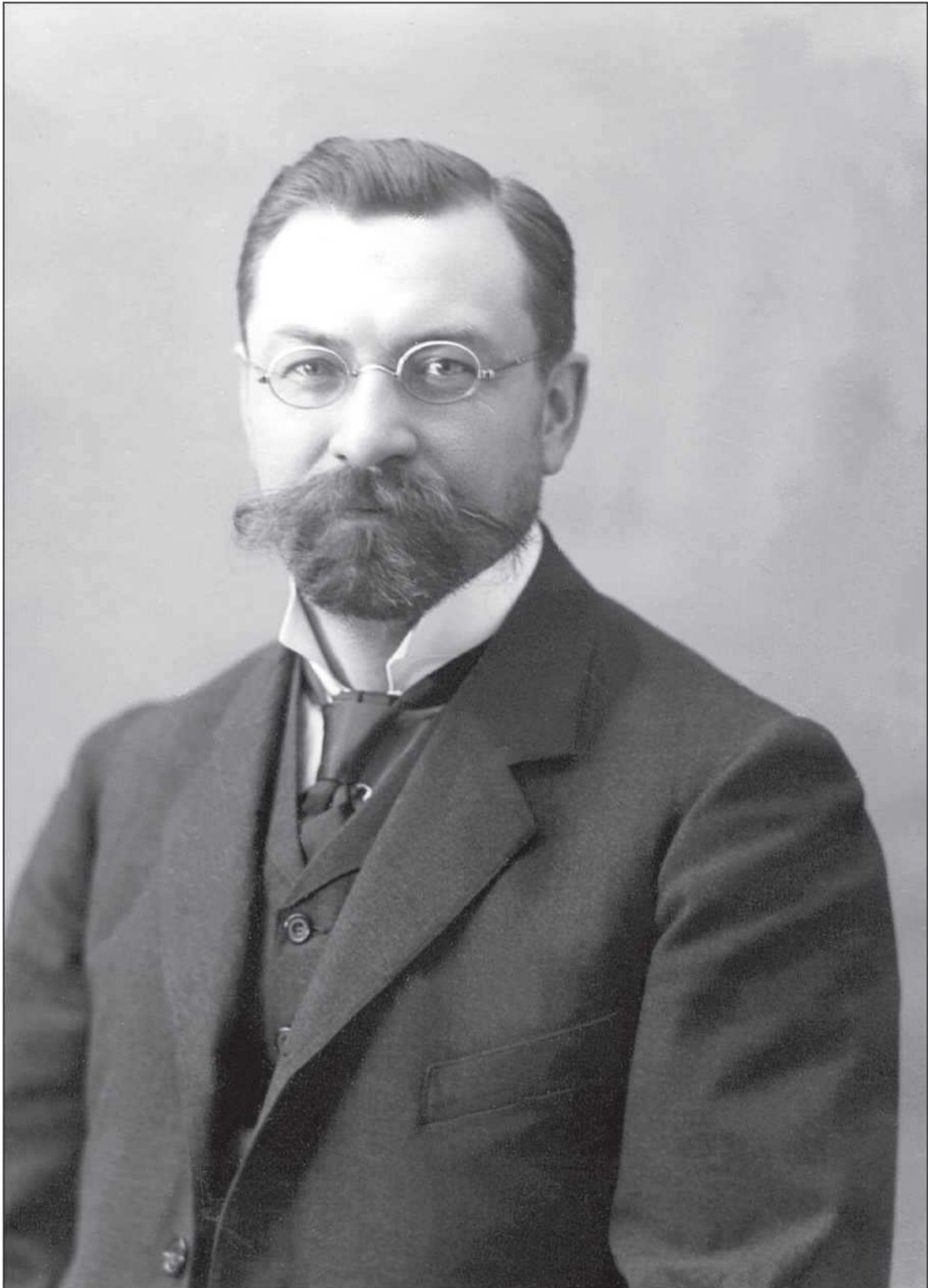
Василий Павлович Шеин. Санкт-Петербург, 1912 год

В 1917 году Василий Павлович был избран в состав Священного Собора Православной Российской Церкви: он вошел в Предсоборный совет, Соборный совет, был заместителем председателя Уставного отдела Собора и секретарем Собора. Избрание его секретарем Собора состоялось 19 августа 1917 года. Заседание проходило под председательством товарища председателя Собора архиепископа Новгородского Арсения (Стадницкого) в присутствии четырехсот