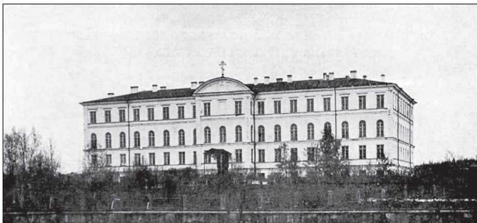
Петрозаводск. Здание Олонецкой духовной семинарии. Почтовая открытка начала XX века