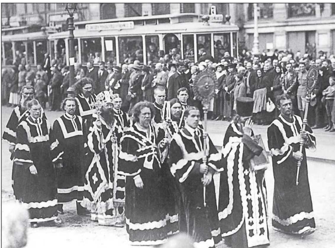
Похороны казаков, убитых в Петрограде в июльские дни 1917 года. Архиепископ Вениамин во главе похоронной процессии. 15 июля 1917 года

Свою позицию относительно происходящего архиепископ Вениамин обозначил в беседе с журналистом петроградской газеты: «Я стою за свободу Церкви, – сказал он. – Она должна быть чужда политики, ибо в прошлом она много от нее пострадала. <...> Самая главная задача Церкви сейчас – это устроить и наладить нашу приходскую жизнь. Еще в качестве управляющего Петроградской епархией я обращался с воззваниями к приходскому духовенству об организации приходских советов и собраний для оживления церковной жизни и встретил самое живейшее содействие как со стороны духовенства, так и мирян».