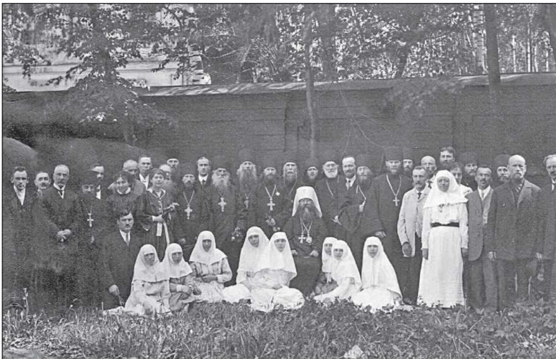
Члены приходского совета Александро-Невской лавры. День Святой Троицы. 17 мая 1920 года