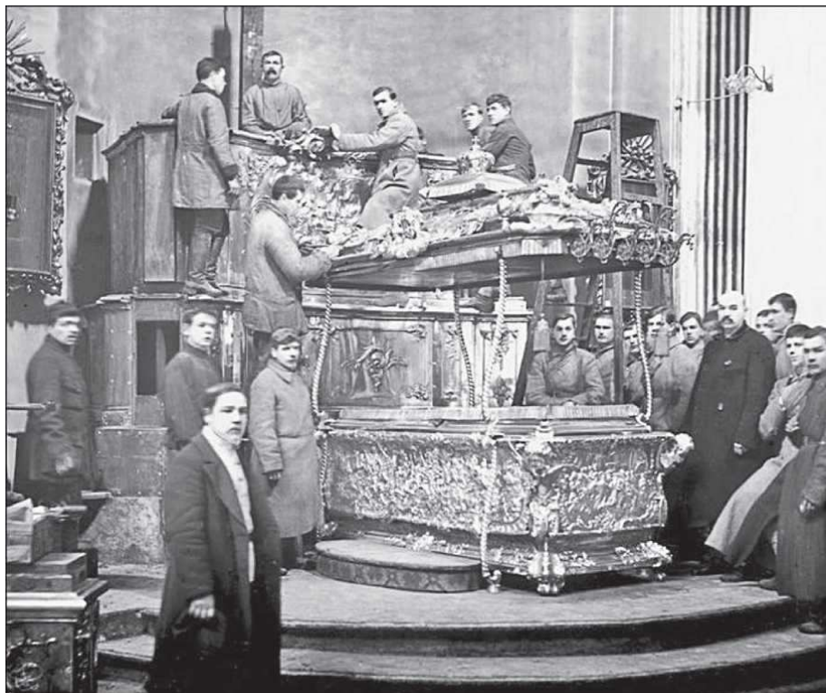
Вскрытие раки с мощами святого благоверного великого князя Александра Невского в Троицком соборе лавры. 1922 год

Не сможем мы всего выкупить – лишатся наши храмы некоторых своих драгоценностей, скорбеть безутешно не будем. Скажем по слову Божию: „Господь раньше дал, Господь теперь взял украшение наших храмов, да будет имя Господне благословенно“ [ср.: Иов, 1, 21]. Проводим изымаемые из наших храмов церковные ценности с молитвенным пожеланием, чтобы они достигли своего назначения и помогли голодающим. Для этого используем, насколько возможно, предоставляемое верующим право по наблюдению за поступлением изымаемых церковных ценностей по назначению и сопровождению предметов довольствия голодающим.