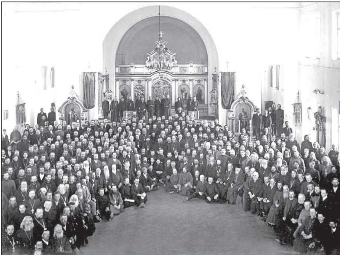
Экзарх Грузии архиепископ Карталинский и Кахетинский Платон, архиепископ Петроградский Вениамин и члены Петроградского епархиального Собора в церкви Исидоровского епархиального училища. 25 мая 1917 года

Уфимского Андрея (Ухтомского) – 364 записки. При вторичном голосовании за епископа Вениамина было подано 976, за архиепископа Сергия – 625, за епископа Андрея – 364 голоса.