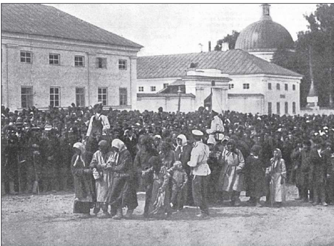
Больные направляются в Успенский собор к мощам преподобного Серафима. 1903 год

Тебе преподали богословские науки, научили тебя логически мыслить, правильно, без ошибок переводить иностранную речь на русский язык, наполнили твой ум массой научных сведений, но... научили ли тебя страдать вместе с несчастным, плакать вместе с плачущим, находить в душе своей