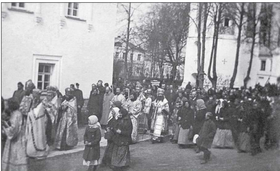
Митрополит Вениамин во время крестного хода

было подписано 19 января, еще до начала заседаний Собора, и таким образом Патриарх всю ответственность за послание и все могущие быть последствия в виде преследований от враждебных Церкви властей брал на себя; не перелагая ее на членов Собора, он лишь приглашал их разделить с ним подвиг исповедничества. Впервые за двести с лишним лет Предстоятелем Церкви была дана независимая оценка происходящему в стране и поступкам действующей власти с религиозной точки зрения, вносился свет во тьму, которая желает выглядеть светом. В лице своего Предстоятеля Русская Православная Церковь тогда обрела свой голос и продемонстрировала свою независимость от государственной власти, до сей поры почти всегда поднимая голос только в ее поддержку и на этом пути в течение двух столетий лишь теряя в глазах народа свой авторитет.