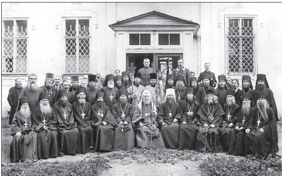
Патриарх Тихон, митрополит Вениамин с викариями и лаврской братией после хиротонии архимандрита Симона (Шлеева) в единовещерского епископа Охтинского (в первом ряду 4-й справа). Александрo-Невская лавра. 16 июня 1918 года

28 марта 1918 года Братство приходских советов в Петрограде приняло постановление: «в целях наибольшего сплочения православных, пробуждения в них сознания единения и тесной связи между собою во всех проявлениях личной, общественной и государственной жизни и поднятия авторитета Церкви в широких массах, а также для предотвращения выступлений членов Православной Церкви на публичных собраниях с кощунственными речами и ввиду все учащающихся, особенно в селах, попыток захвата церковного имущества, ценностей» просить митрополита Вениамина разрешить приходским собраниям избирать приходские суды, которые имели бы право «судить выступающих с речами кощунственного характера, участвующих в захвате церковных имуществ, ограблении храмов и тому подобных святотатственных делах», подвергая их церковным наказаниям: «запрещению приступать к Святым Тайнам, лишению общения в молитвах церковных, отвержению от житейских взаимоотношений с близкими и знакомыми и проч., вплоть до исключения, в случае нераскаяния, из общения церковного и лишения православного погребения».