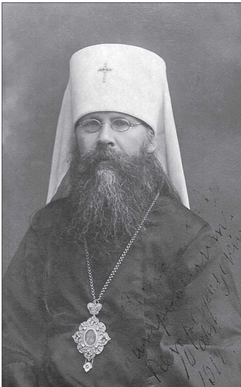
Митрополит Петроградский и Гдовский Вениамин. 10 августа 1918 года

присутствием всего духовенства благочиния; <...> за праздничным всеобщим бдением прочитывать на русском языке положенные по уставу пролог и святоотеческие творения; по возможности за всеми богослужениями поучать верующих изустным словом».