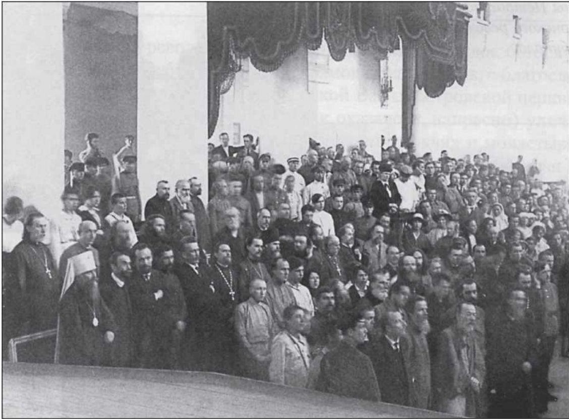
Обвиняемые во главе с митрополитом Вениамином на скамье подсудимых.1922 год