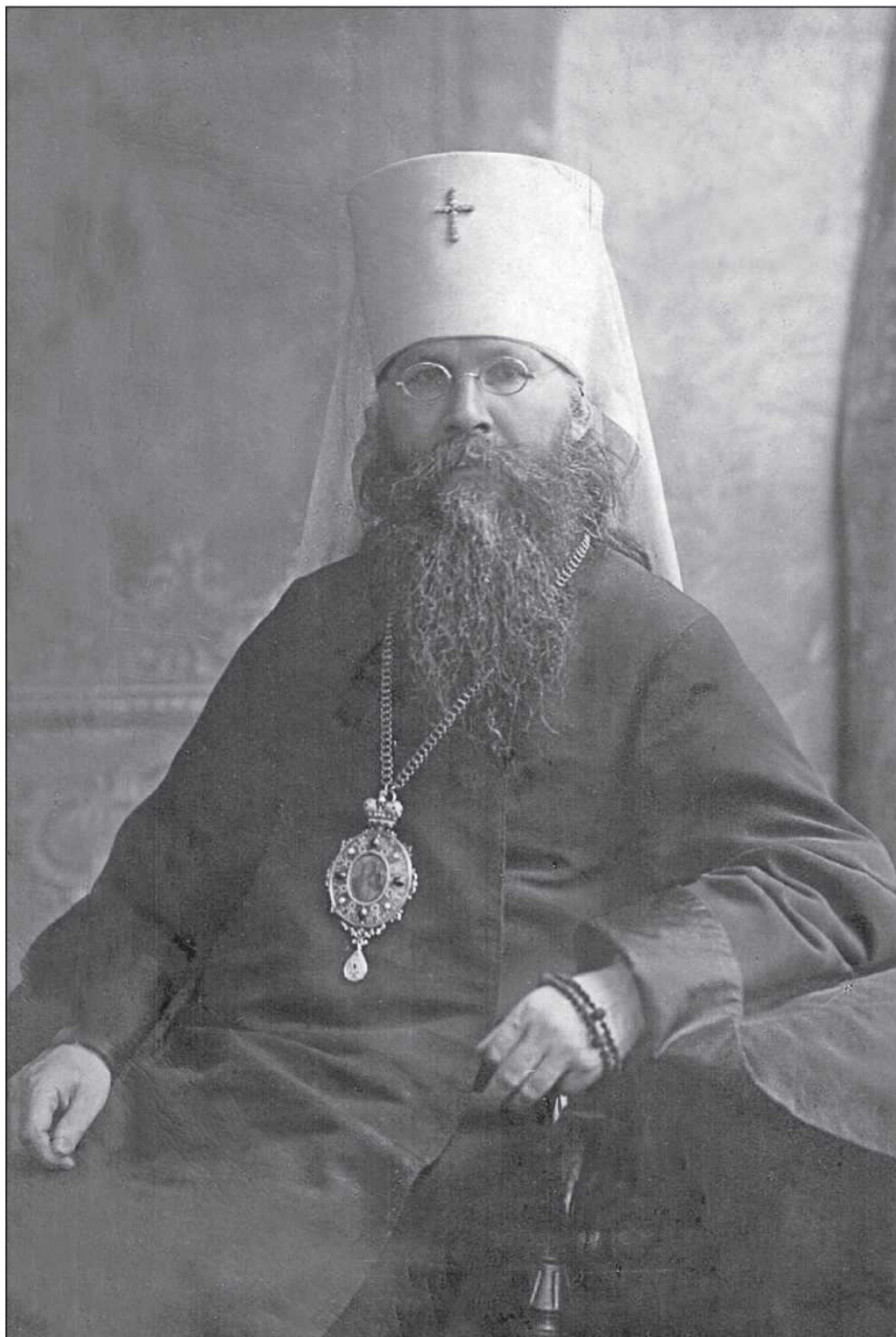
Митрополит Петроградский и Гдовский Вениамин

[ср.: Ин. 20, 19, 21], сказанные апостолам, страха ради собранным в комнате дверем заключенным. Меня особенно трогало, что на молебне по „Отче наш“ пели тропарь „Заступница Усердная“. Я невольно падал на колени и со слезами молился. Многие день и ночь проводили то в подвале, то в подземной церкви безвыходно. В пятницу осада церкви кончилась.