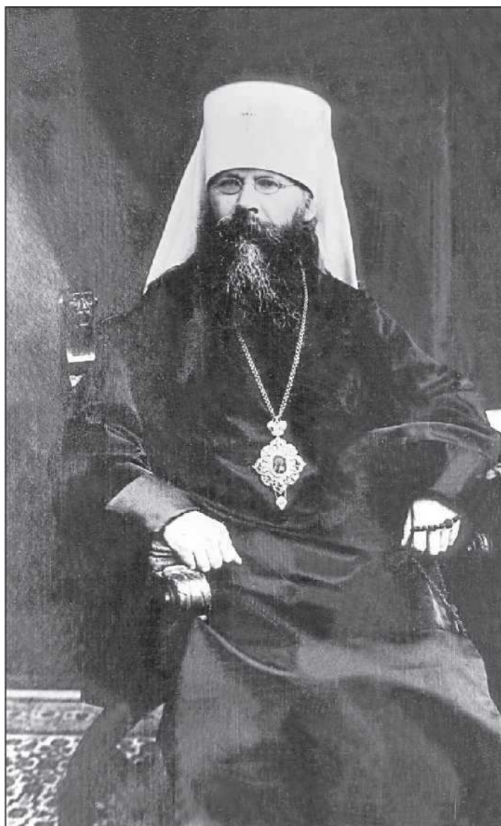
Митрополит Петроградский и Гдовский Вениамин.1918 год

даже может показаться в иные минуты, что мрак снова облегает землю и князь мира сего готов торжествовать победу.