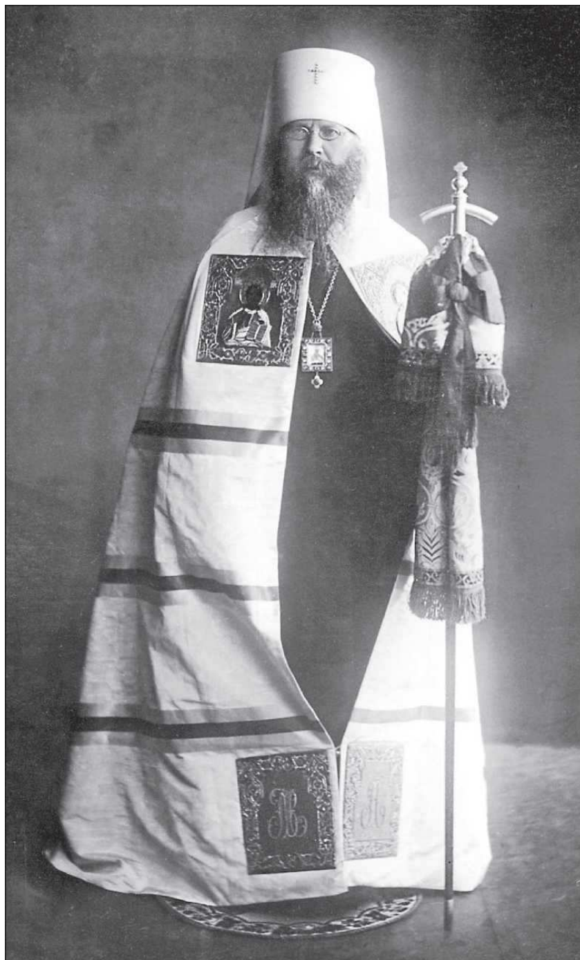
Митрополит Петроградский Вениамин. 1918 год.

реквизиции всего лаврского имущества. Иловайский в ответ повторил свое требование и заявил, что, если оно не будет выполнено, он вынужден будет применить силу. Затем комиссар в сопровождении красногвардейцев направился в собрание духовного собора лавры, где в то время находился наместник лавры преосвященный Прокопий, и потребовал от епископа сдать ему все лаврское имущество: вещи, капиталы и помещения. Преосвященный Прокопий категорически отказался исполнить это требование. Тогда его объявили арестованным и отвели в келью. Духовный собор лавры также был объявлен арестованным, и к нему был приставлен караул из красногвардейцев.