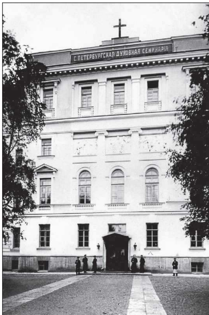
Санкт-Петербургская духовная семинария

Отсюда естественный вывод: здесь не место тому, кто не хочет учиться или кто хочет учиться, но не тому и не в том направлении, чему и в каком направлении определено учиться в духовной семинарии. Здесь нет и не может быть места тем лицам, которые желают заниматься политическим и социалистическим переустройством нашего государства; таким лицам место в какой-нибудь Государственной думе или Государственном Совете, а не в скромном учебном заведении; здесь не может быть места тем, которые, горя гражданской ревностью, желали бы потрясать сердца простых смертных и верховодить толпой: их место в собраниях и на митингах. Равным образом здесь нет места и тем, которые желали бы вести образ жизни беспечный и легкомысленный: их место где угодно, но не в духовной семинарии, которая должна выпустить в свет пастырей стада Христова и учителей православного русского народа, светильников Церкви и соль земли.