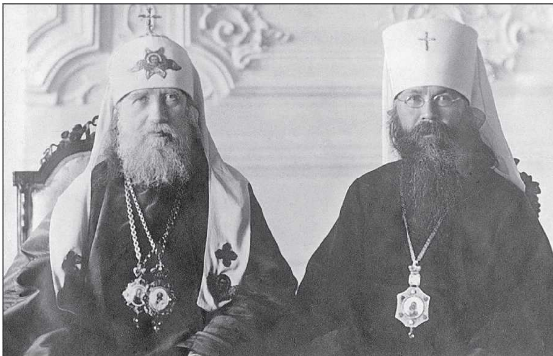
Патриарх Тихон и митрополит Вениамин в Митрополичьих покоях Александро-Невской лавры. 1918 год.

припомнил слова Иисуса Христа, обращенные Им к Иерусалиму: „О, если бы град сей хотя теперь бы познал, что служит ко спасению его“ [ср.: Лк. 19, 42].