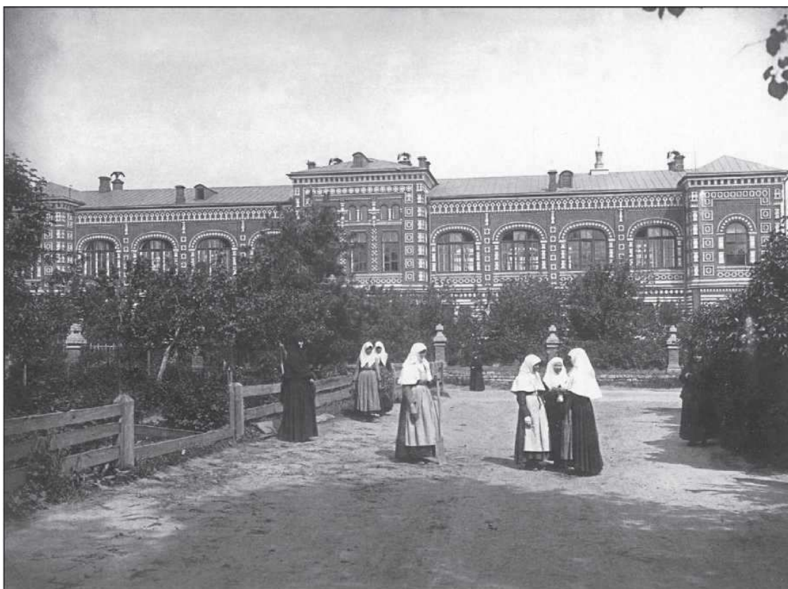
Серафимо-Понетаевский Скорбященский монастырь

душа и юное сердце будут неизбежно калечиться и вправе апеллировать к высшей справедливости. У духа человеческого есть свои вечные, неотъемлемые права; его нельзя ни сковать уставами, ни инструкциями, ни убаюкать мертвыми предметами и снотворными лекциями; он силится сокрушить свою темницу и порвать стесняющие его путы. Вы, отец ректор, обратили внимание на самый существенный недостаток почти всех казенных заведений, в которых всюду веет холодом, тоскливым однообразием, какой-то неестественной самозамкнутостью, отчужденностью и бездушным формализмом, где и начальствующие, и подчиненные несут какую-то тяжелую повинность по отношению друг к другу и потому всей силой души ненавидят друг друга. Вы обратились к лучшим сторонам души своих питомцев и сумели сделать их ответственными перед самими собою, перед своею совестью и нравственным долгом.