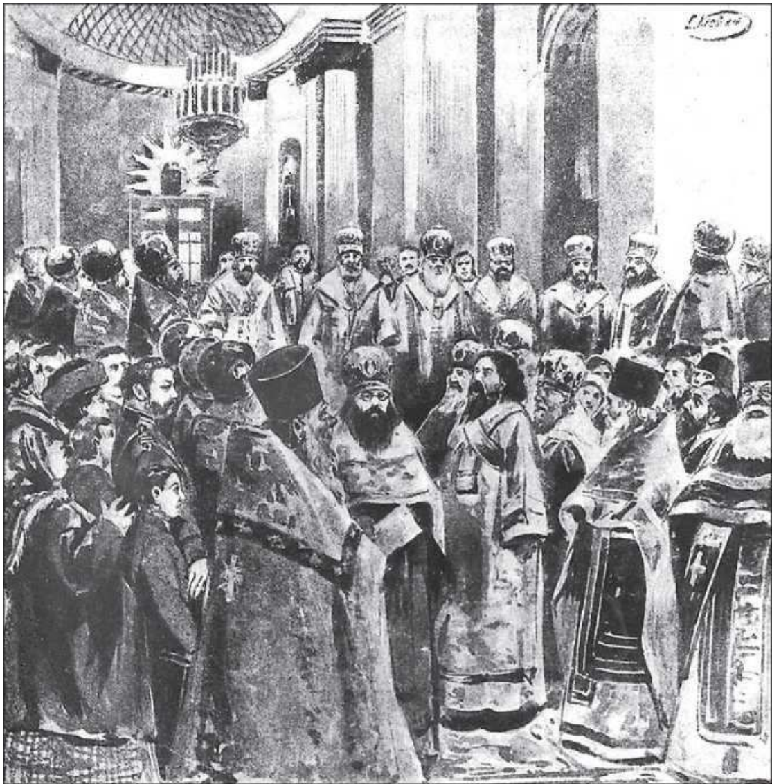
Хиротония архимандрита Вениамина во епископа Гдовского в Троицком соборе Алекса́ндро-Невской лавры 24 января 1910 года.

24 января 1910 года в Троицком соборе Алекса́ндро-Невской лавры архимандрит Вениамин был хиротонисан во епископа Гдовского, четвертого викария Санкт-Петербургской епархии. О нем писали в то время, что «среди духовенства и вообще в столице архимандрит Вениамин успел стяжать любовь и уважение и известен как выдающийся проповедник и ревностный деятель Общества религиозно-нравственного просвещения в духе Православной Церкви».