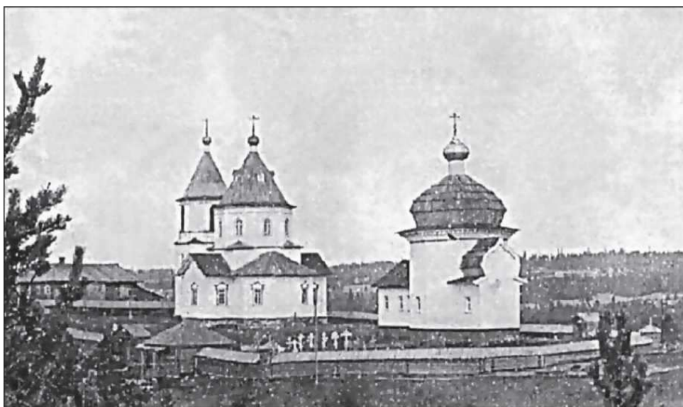
Нименский погост. Начало XX века