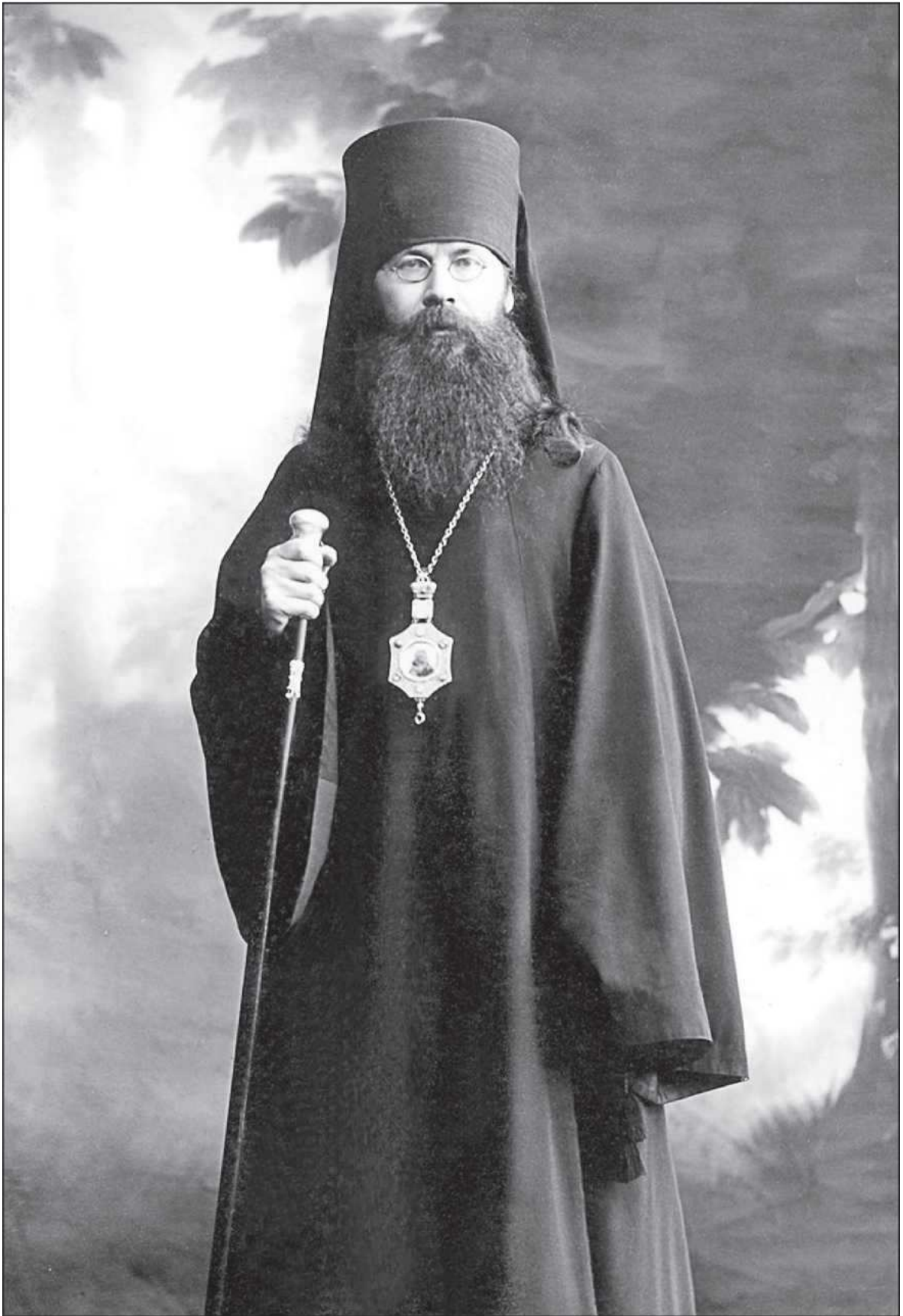
Епископ Гдовский Вениамин. 1910 год.