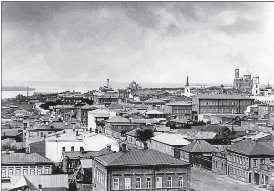
Самара. В центре – собор и колокольня Иверского женского монастыря, справа в глубине – Воскресенский кафедральный собор