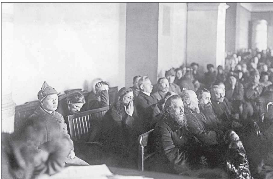
Судебный процесс. Петроград, 1922 год