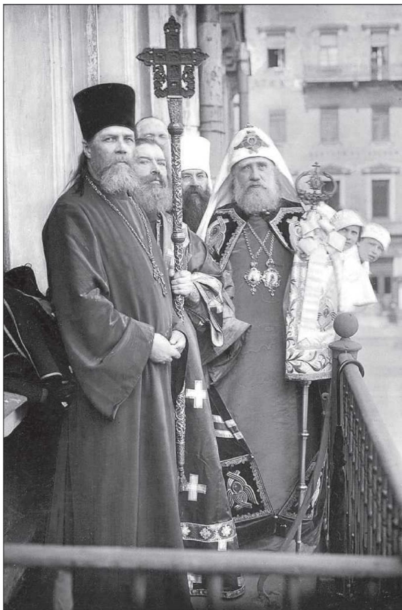
Патриарх Тихон, митрополит Вениамин и протоиерей Философ Орнатский на балконе дома причта Казанского собора. 13 июня 1918 года

уверенность, что он от членов епархиального совета будет всегда слышать беспристрастные мнения и суждения о каждом деле, независимо от того, какого мнения в этом деле держится лично он, так как до сего времени, весьма нередко, правящему архиерею приходилось довольствоваться при сношении с подчиненными ему учреждениями и лицами только выражением полного одобрения своим собственным взглядам и решениям по тем или иным вопросам. <...> Митрополит указал, что как он в своей архипастырской деятельности далек от политики, имея в виду только благо Церкви, так равно просит и совет не вносить в свою деятельность политики. Задачи совета – служить Церкви Божией – настолько велики и важны, что тут не должно быть места преходящим веяниям и течениям». Митрополит призвал членов совета с полной откровенностью высказывать свои суждения. «Архиереи, – сказал митрополит, – часто считают себя непогрешимыми только потому, что им всегда поддакивают». Он не хочет этого поддакивания и просит совет иметь свое мнение.