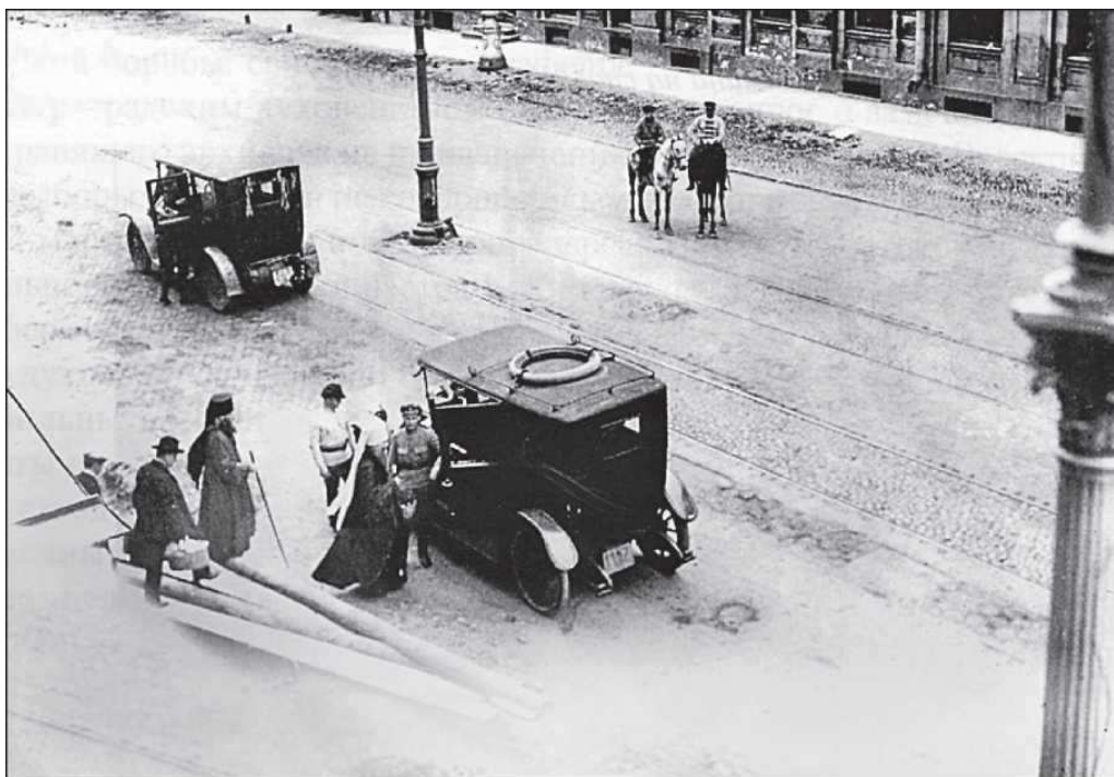
Митрополит Вениамин и епископ Кронштадтский Венедикт (Плотников) у автомобиля, в котором их доставляли из Дома предварительного заключения в зал суда

церковное имущество вместе с собственностью передано гражданской власти; к тем обществам, которым передано это имущество, и нужно всем обращаться. Духовенство является участниками распоряжения церковным имуществом постольку, поскольку они являются членами этих обществ.