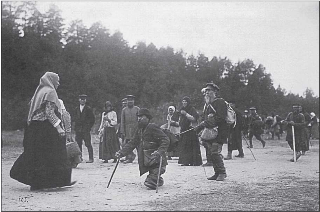
По дороге в Саров. 1903 год

В этот момент всего больше сказался отказ в гостеприимстве Саровской обители. Не счесть и не описать никакими словами тех духовных лишений, которые получили будущие пастыри от невозможности видеть лицом к лицу великое, собравшееся у святого источника всенародное русское горе. Что такое Валаам в сравнении с этим уроком скорби и страданий?! Там – мы почти и не видали подвига, там многое казалось непривычным мирскому взору, многие труды и усилия оставались неоцененными, вызывали, быть может, недоверие, переоценку, а здесь... здесь разве можно устоять перед сильнейшим всякой логики впечатлением, которое производит иссохший, полуживой человек с язвами на лице, на руках, на всем теле, с гнойными ранами, с нестерпимым смрадным запахом распространяющегося по всему телу гниения. Разве можно устоять перед непобедимой логикой безысходной человеческой печали, которая находит себе выражение в горьких слезах и столах?!