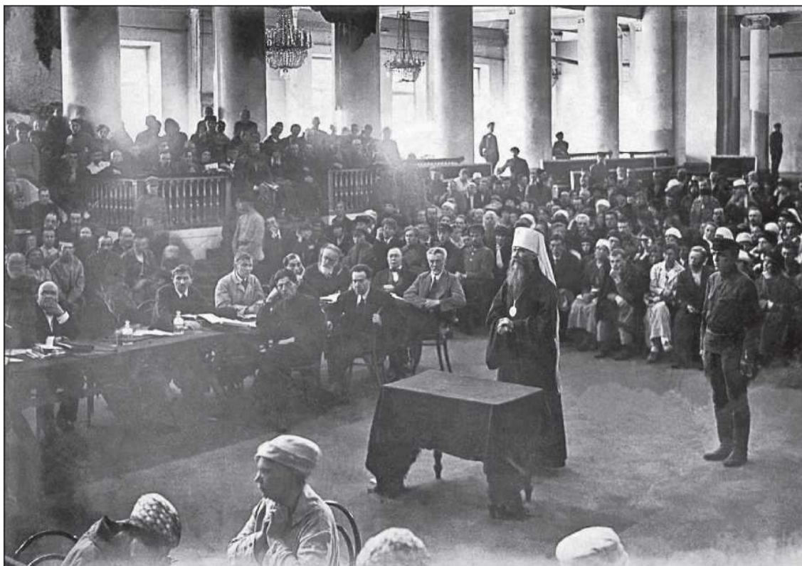
Допрос митрополита Вениамина на суде. 12 июня 1922 года

После полуторадневных допросов, которые за отсутствием обвинительного материала, даже формально не подготовленного, когда судьи и обвинители при уже известном им приговоре лишь тянули время, судебные заседания превратились в утомительную для подсудимых процедуру, угнетая их фатальным предчувствием обреченности. Во время одного из таких бессмысленных, с точки зрения выяснения истины, допросов председатель суда с издевкой спросил митрополита: