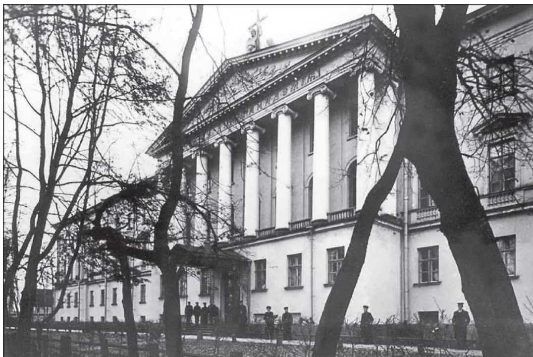
Санкт-Петербургская духовная академия