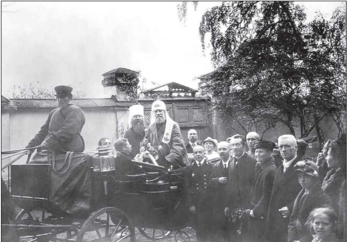
Патриарх Тихон и митрополит Петроградский Вениамин. Петроград. Июнь 1918 года