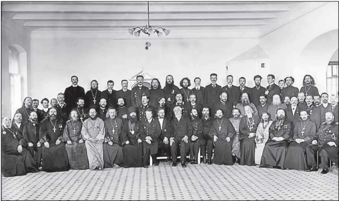
Епархиальный училищный совет и деятели церковно-приходских школ Санкт-Петербурга во главе с епископом Гдовским Вениамином. В центре – обер-прокурор Святейшего Синода В.К. Саблер

После назначения викарием епископом владыка Вениамин возглавил епархиальное Братство во имя Пресвятой Богородицы, которое до своего перевода на Тамбовскую кафедру возглавлял епископ Гдовский Кирилл. Совет Братства обладал правами епархиального училищного совета, и таким образом его председатель становился руководителем всех церковно-приходских школ Санкт-Петербургской епархии. Центральным храмом Братства и одновременно местом пребывания Гдовских епископов был Покровский храм на Боровой улице. Здесь епископ Вениамин старался служить как можно чаще, здесь же он ввел в практику чтение при общенародном пении акафистов по средам до отдания Пасхи; после прочтения акафиста епископ вел «беседы на тексты апостольских посланий, останавливаясь по преимуществу на местах Священного Писания, изобличающих неверие и упадок нравственности», все более распространявшиеся в то время.