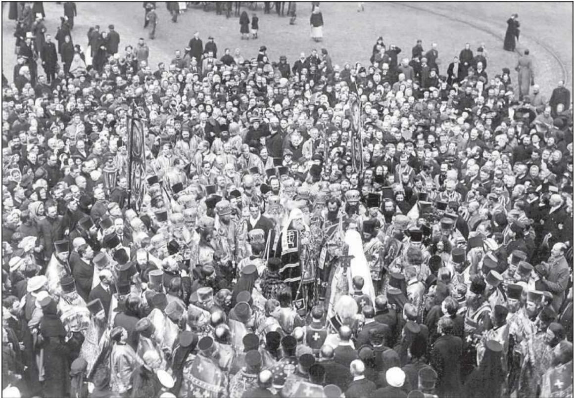
Встреча Патриарха Тихона у Александро-Невской лавры. 11 июня 1918 года.