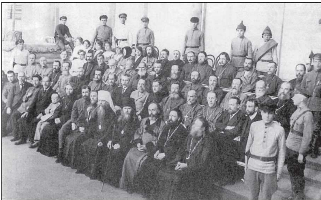
Последнее фото обвиняемых во главе с митрополитом Вениамином перед вынесением приговора. 5 июля 1922 года

По окончании чтения приговора раздалась многочисленная и дружная аплодисменты – это рукоплескали студенты Зиновьевского университета, этими рукоплесканиями невольно напоминая о событиях, происходивших когда-то во времена гонений на христиан в судах Римской империи. Для судей «спектакль» был окончен, и они, уже не в силах держаться той роли, которую играли все эти дни, почти бегом ринулись из зала. Адвокаты были ошеломлены внезапностью их бегства и стали им вдогонку кричать: «Мы кассацию подаем... мы просим принять заявление, что мы подаем кассацию...» Но судей уже и след простыл. Затем покинули зал публика, обвинители и адвокаты. Остались лишь осужденные и конвоиры, еще теснее их окружившие.