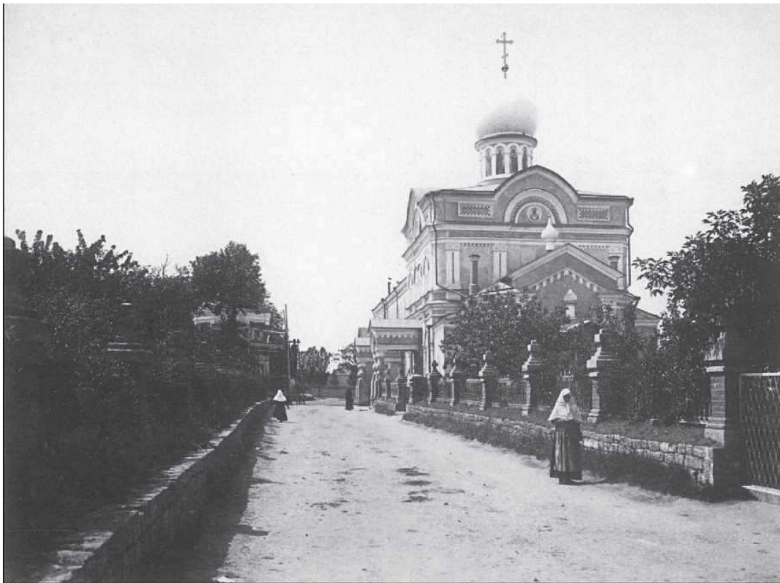
Серафимо-Понетаевский Скорбященский монастырь

ближнюю и дальнюю пустыни, еще раз подтвердившие общее впечатление от посещения Сарова: «Здесь вся Россия с ее горем, с ее надеждами и ожиданиями. Смесь различных верований, взглядов, священных гимнов, поверий и даже суеверий. Здесь тысячи легенд о праведном старце. <...> Здесь каждый час пребывания с верующим народом равняется прочитанной книге».