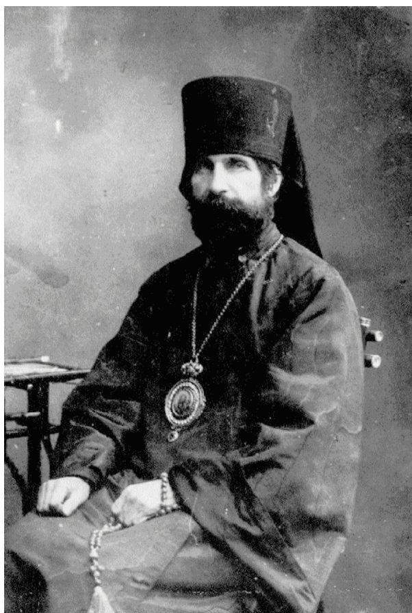
Епископ Вениамин (Воскресенский)

В результате гастролей Вениамина в Рыбинск, где он также выступал с проповедями, в Ярославский отдел ОГПУ в мае месяце поступило заявление от Спасской автономной общины о недопущении вторичного приезда в Рыбинск Вениамина, так как он своими проповедями будоражит верующих, натравливая одно течение на другое, и подрывает авторитет обновленчества как со стороны религиозной, так и со стороны гражданской – прозрачными намеками на благосклонное отношение власти к обновленчеству, что уже имеет политический характер. И вообще на всем протяжении церковной деятельности епископа Вениамина красной нитью проходит его борьба с советской властью на религиозном поприще, в которой через проповеди он твердо проводит свою линию едкой критики мероприятий советской власти в религиозном вопросе, с целью возбуждения умов верующих. Свою борьбу по этому вопросу он даже не особенно старается скрыть, заявляя официально, что советскую власть признает, "кроме религиозной политики".