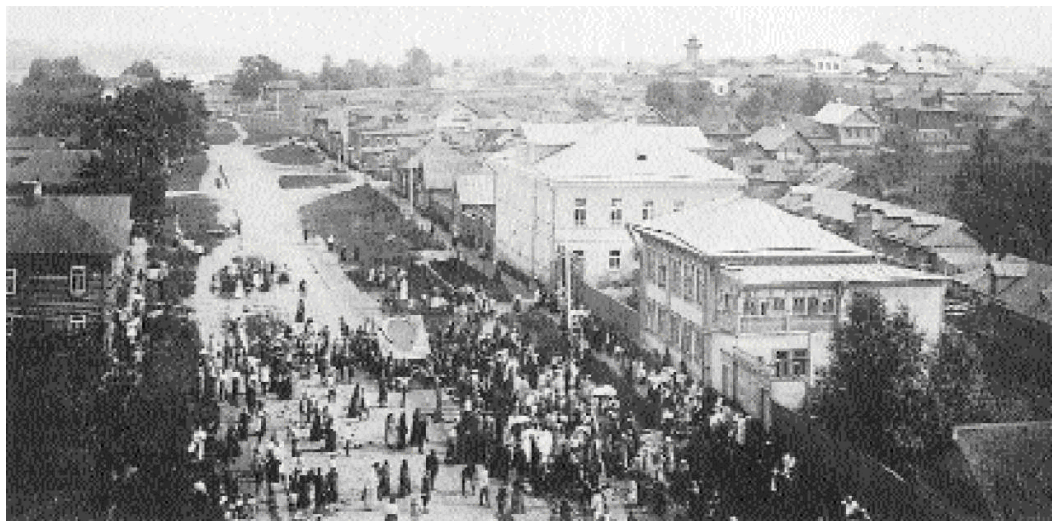
Крестный ход с иконой Всемиловитового Спаса. Романов-Борисоглебский. Фото XIX века

Патриарх Тихон разрешил одно время не называть его имени на церковных возгласаниях. Это – "икономия", допустимая и к митрополиту Сергию. Поминание митрополита Сергия не обязательно канонически, но можно сказать, что при признании его, – морально обязательно. Но если имя его временно связывается с Декларацией, бесславящей Церковь, и поэтому вызывает смущение, то допустимо непоминание его по "икономии".