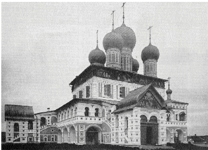
Воскресенский собор, вид с северо-западной стороны. Фото конца XIX века

паству, которые уже выступили не только против архиепископа Павла, но и викария Ярославской епархии архиепископа Варлаама (Ряшенцева), не возразившего против такого порядка вещей. Ярославская епархия вновь оказалась на грани раскола.