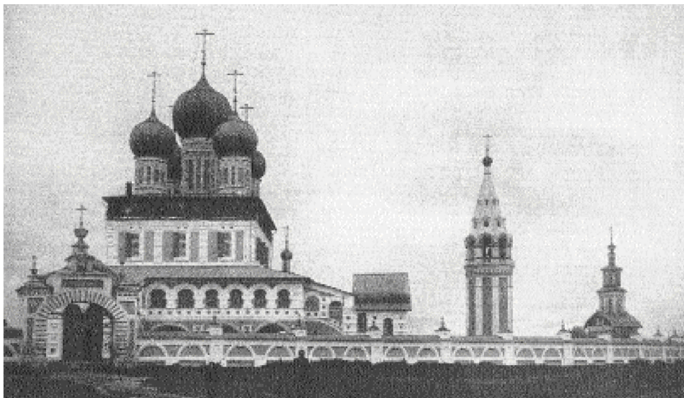
Воскресенский собор, кафедральный храм епископа Вениамина. Вид с западной стороны. Фото конца XIX века

преддверии смерти, не решился выступить с судом (отделение означает именно суд) без суда Церкви. Я тоже не решаюсь и боюсь. Я повинуюсь митрополиту Сергию. Это не означает, что я соглашаюсь с декларацией... Я с ней не соглашаюсь, я против нее, я осуждаю ее. Я не "мирюсь" и не "соглашаюсь" с митрополитом Сергием и считаю его виновным, а просто повинуюсь. Я хочу быть послушным Церкви и ее канону: без суда не суди. Я боюсь выступить с судом без суда Церкви. Кто поступает лучше – предоставляю решить церковному сознанию».