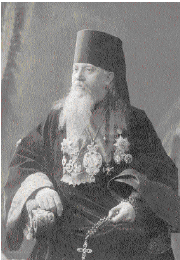
Архиепископ Агафангел (Преображенский)

Будь Собор – несомненно, митрополит Сергей, лишенный доверия, "был бы заменен" другим, но, можно с уверенностью думать, не лишен бы был церковного общения. Нет оснований исключать его из церковного общения и теперь, а значит, нет основания совершать отделение. Так как Собора нет, то можно, по крайней мере пока, допустить его и как представителя власти – здесь может иметь место церковная "икономия". Не отделение, а скорее допустима отставка митрополита Сергея, но по обстоятельству времени нет структурной возможности произвести такую "отставку", и поэтому икономия Церкви говорит о продолжении пребывания митрополита Сергея в звании носителя власти...»