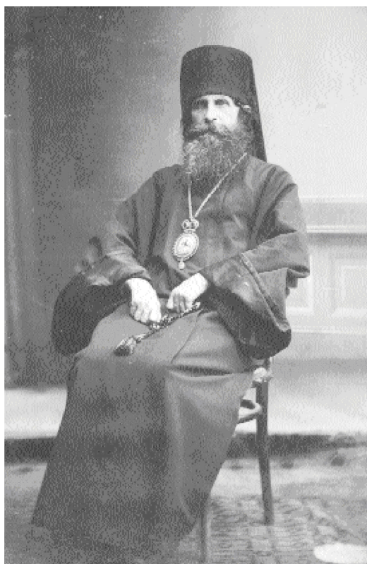
Епископ Вениамин (Воскресенский)

времени. Не попала такая мелодия в печатную книгу случайно, только потому, что ее никто не подслушал из тех людей, которые печатают книги».