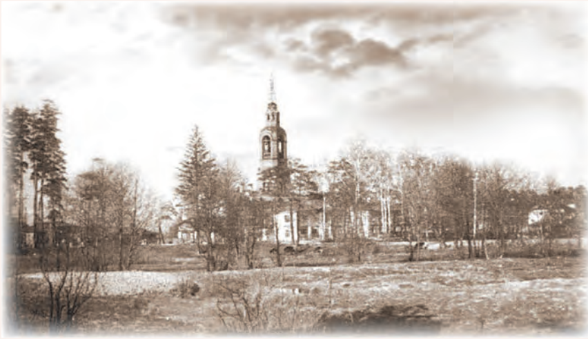
Гуслицкий Спасо-Преображенский монастырь

Витебской губернии*, в селах Владимирской губернии, расположенных вблизи Гуслицкого Спасо-Преображенского монастыря.