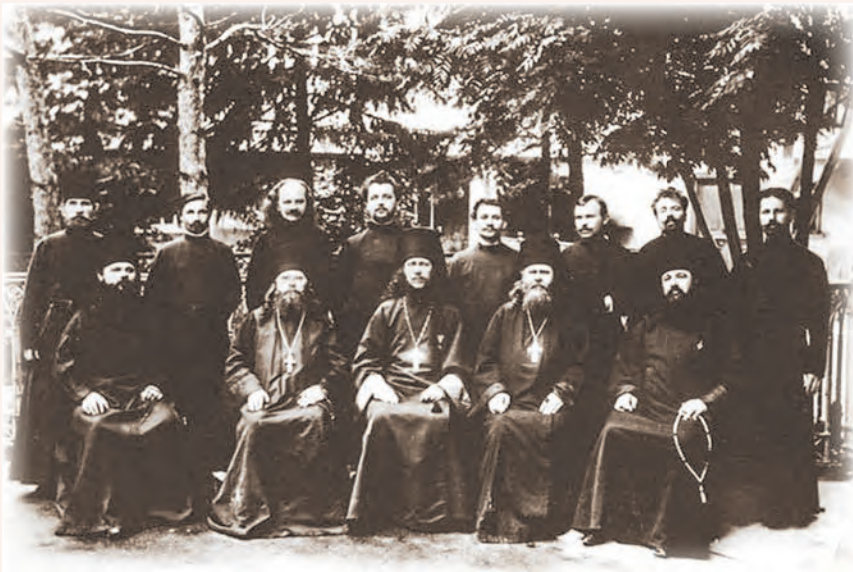
Братия Николо-Перервинского монастыря