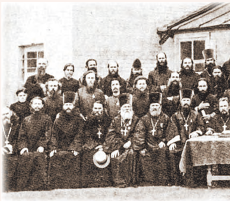
Первый всероссийский миссионерский съезд. Москва, 1887 год

И вот раскрылись на съезде наши собственные язвы, к которым надо было отнестись с должным вниманием. Тут-то и начал я хлопотать о назначении жалования беднейшему сельскому духовенству, особенно в зараженных