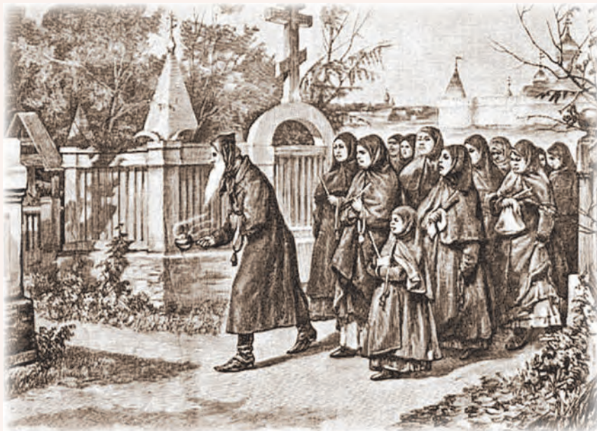
Читалки и уставщик федосеевского толка, служащие панихиду на Преображенском кладбище