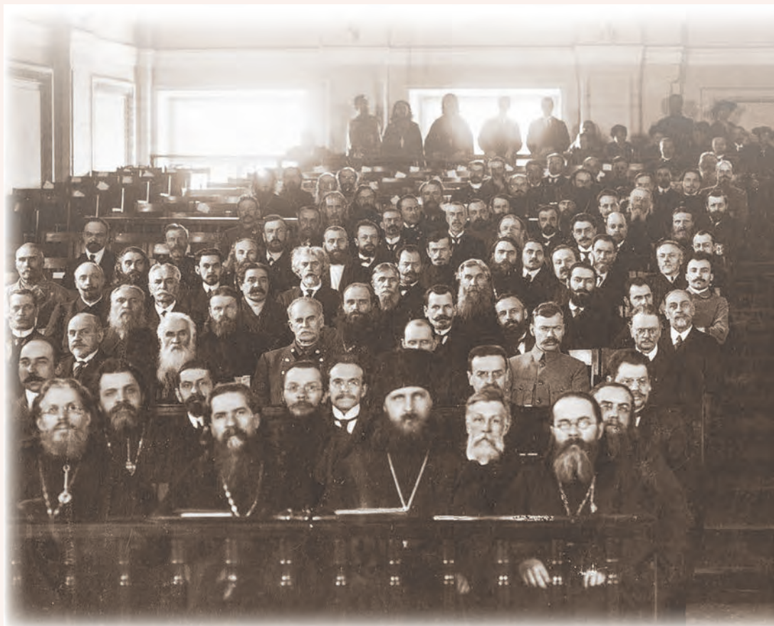
Члены Поместного Собора Российской Православной Церкви.

Большую полемику на Соборе вызвали проекты постановлений о церковном браке и в особенности предлагавшие основания для развода. И более всего то предложение, что основанием для развода могут стать «нанесения... другим супругом неоднократных тяжких оскорблений и вообще причинения ему расшатывающих самые основы семьи постоянных нравственных истязаний» 222 . Многие члены Собора сочли эту статью противоречащей христианскому вероучению, делающей возможным расторгать