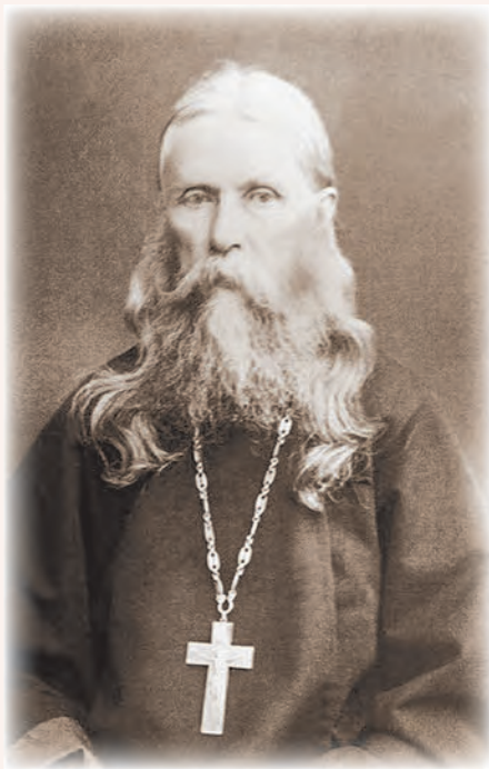
“о, „ерей , „нн’ ин, г°д, в