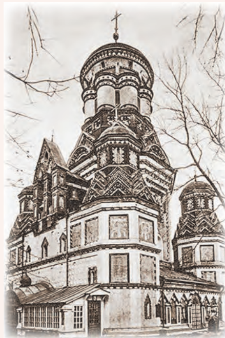
Церковь в селе Дьякове