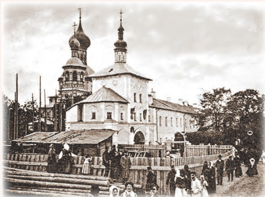
Общий вид Николо-Перервинского монастыря и место постройки нового храма