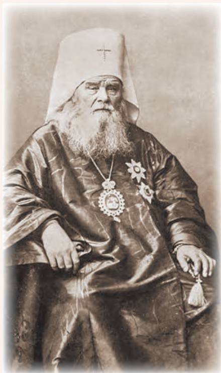
Митрополит Московский Иннокентий (Вениаминов)