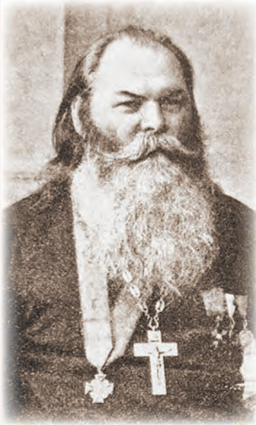
Š ротои ре^ К^, нофонт Кр ч"о~