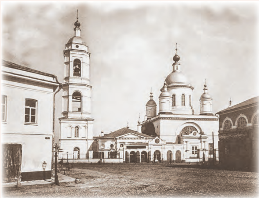
Церковь в предбанье Семеновской в Петербурге с колокольней