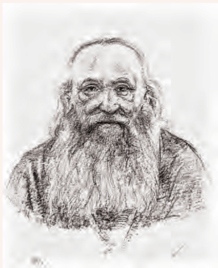
Архиепископ Антоний (Храповицкий). Рисунок В. В. Богдановича

и т. д. Все, что было противощерковно, что было враждебно Церкви, — все это собиралось на съездах сейвесны и сего лета и поднимало вопль. <...>