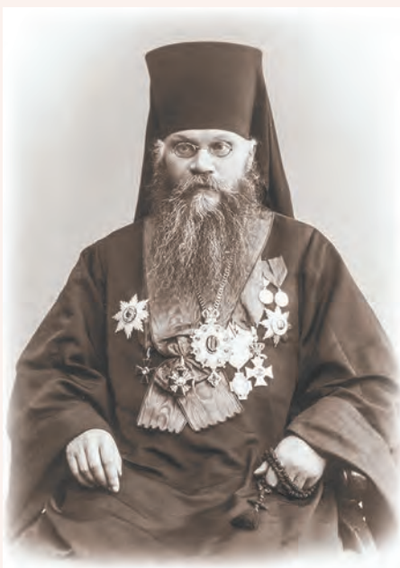
Епископ Тихон (Никаноров)

25 ноября 1901 года новый настоятель Троицкого храма, священник Василий Богоявленский, сознавая всю актуальность проблемы просвещения раскольников, направил прошение митрополиту Московскому и Коломенскому Владимиру (Богоявленскому), выразив в нем обеспокоенность тем, что множество людей находятся в состоянии отпавших от Церкви. «Возможно ли в ближайшее время решить