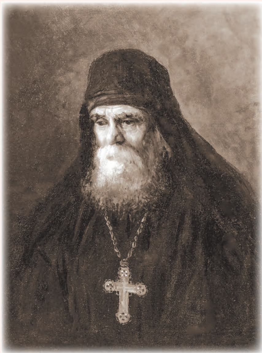
Архимандрит Павел (Леднев). Художник А. Корольков