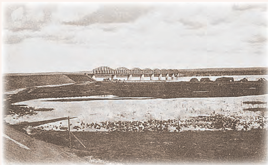
Мост через реку Каму