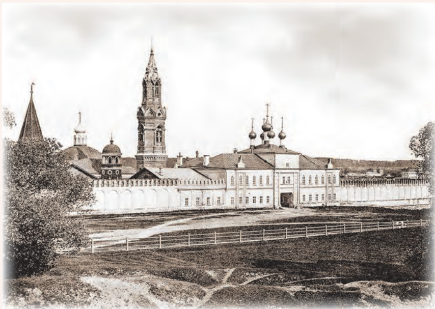
Никольский единоверческий мужской монастырь