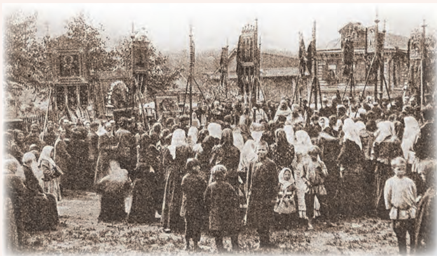
«... о б, н старообрядц, в во вр, мя кр, тного хода в с, °е Бори °о»