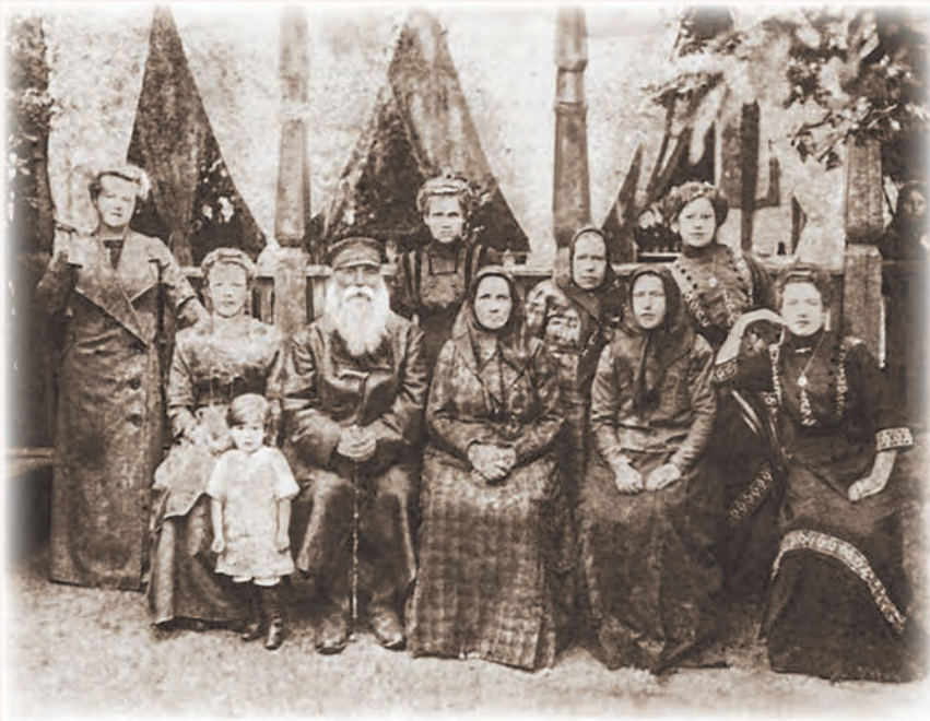
Бабушки, около 1913 года