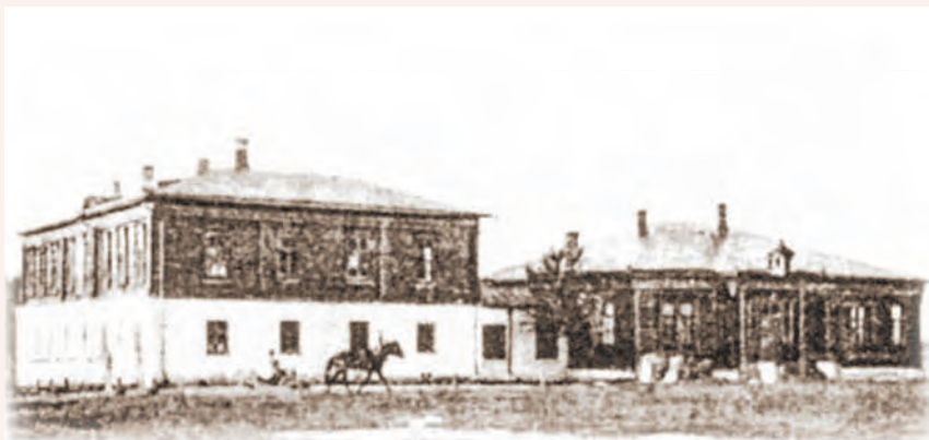
Второклассная церковно-приходская школа при Гуслицком Преображенском монастыре

или иначе проявленной ими склонности в духовные школы, должны и выходить из стен заведения чистыми и невинными юношами, не наученными в общежитии дурным привычкам и порокам: курению табаку, пьянству, сквернословию, кощунственным козлогласованиям, несоблюдению постов, лживости. На эти „мелочи“ не обращают воспитатели должного внимания, быть может, по убеждениям своим не придавая им серьезного значения, а между тем привитые еще на школьной скамье привычки эти почти всегда лишь с величайшим трудом искореняются, требуя от возымевших желание бороться с ними не для всех возможного напряжения силы воли, обусловливающего победу, при усиленной притом молитве о благодатной помощи свыше. Отрицательные же навыки эти несовместимы с благотворно-полезной деятельностью иерея Божия. <...>