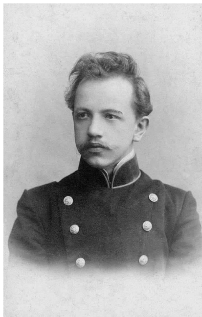
Сергей Иванович Голощапов. 1908