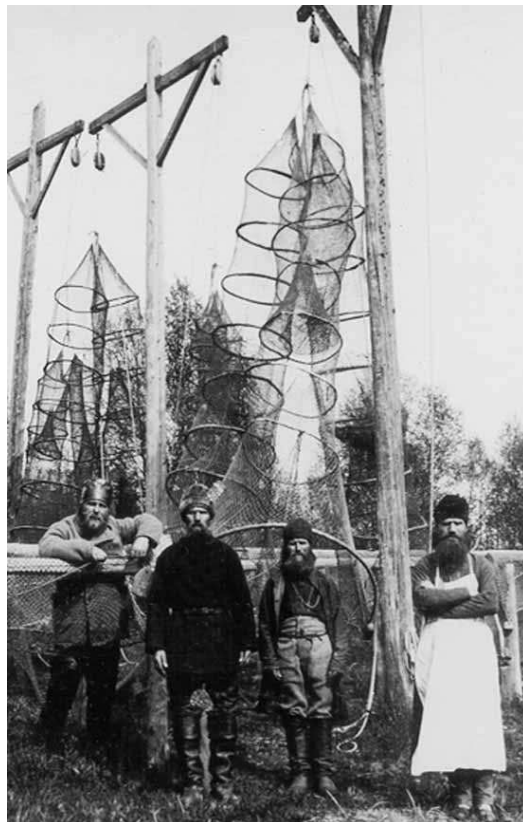
Архиепископ Иларион (крайний слева) Соловецкий концлагерь