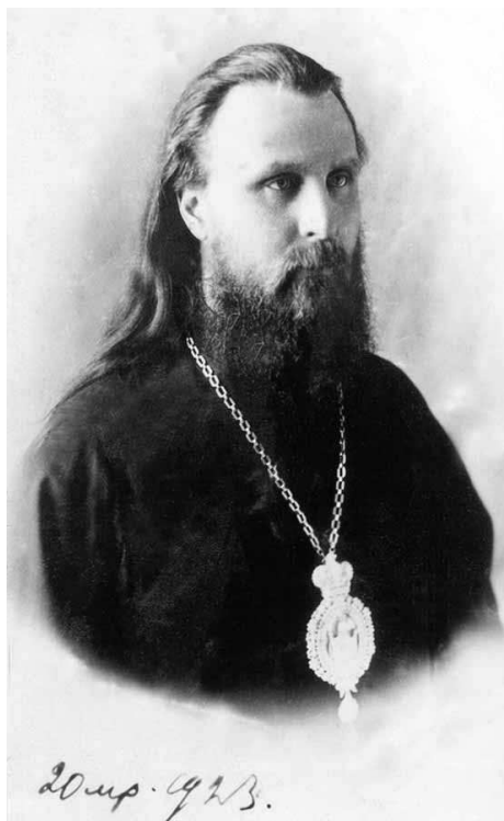
Епископ Иларион. Архангельск. 1923 год

«Теперь можно положительно сказать, что изъятие ценностей было ненужным предприятием. Судя по отчетам, ценностей получено не более как на двадцать миллионов золотых рублей. Теперь сосчитайте, чего стоит самое изъятие, перевозка, переливка (с угаром и... утечкой). Ведь в иных местах ящики для упаковки стоили столько же, сколько самые ценности. Прибавьте еще расходы по содержанию в тюрьмах тысяч арестованных по этому делу. Расходы на следствия и суды... Боюсь, не пришлось бы переплатить... Ведь в газетах лгали, что в храмах такие миллиарды, что ценностей будет поездов семь верст длины (это так писали бессовестные люди)... Бесчестные диоклетианы, нероны, декии прямо говорили: нельзя быть христианами, иначе казнь. А Ваши любимцы говорят и трубят на весь свет: у нас свобода совести самая полная, у нас отделение Церкви от государства.