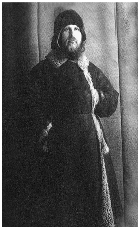
Архиепископ Иларион в заключении

Родственнице архиепископ в это время писал: «Меня хоть никто дедушкой не называет. Однако иной раз случалось, что стариком назовут, и то странно слышать. Меня больно уж борода вы дает – поседела, как неведомо что. Однако душа, чувствуется, еще не постарела. Интересы в ней всякие живут и рождаются.