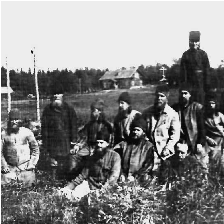
Архиепископ Иларион (во втором ряду третий справа) Соловецкий концлагерь

В лагере владыка сохранил монашескую нестяжательность, детскую незлобивость и простоту. Он просто отдавал всем все, что у него просили. Ни на какие оскорбления окружающих никогда не отвечал, казалось не замечая их. Он всегда был мирен и весел, и если даже что и тяготило его, он не показывал этого. Из всего происходящего с ним он всегда стремился извлечь духовную пользу, и, таким образом, ему все служило ко благу.