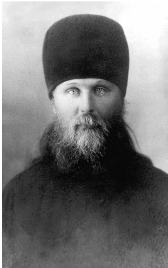
Архиепископ Иларион Соловецкий концлагерь. 1929 год

Словом, внутри у меня неизвестность и неопределенность. Чего пожелать самому себе – тоже не знаю. Ведь в иных отношениях у нас здесь лучше вашего, да и прижился за долгие годы. Только душа просит нового...»