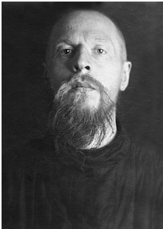
Архидиакон Серафим (Вавилов). Москва, Таганская тюрьма. 1938 год

Архидиакон Серафим был арестован 26 января 1938 года и заключен в Таганскую тюрьму в Москве.