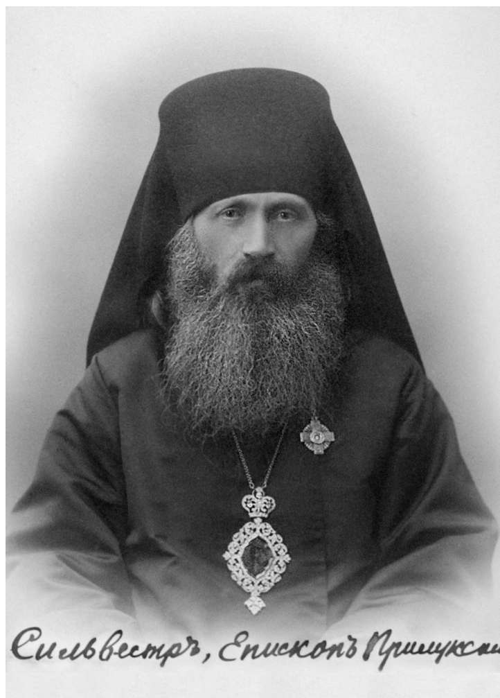
Сильвестр, епископ Прилукский, викарий Полтавской епархии. 1911 год

вручая жезл новопоставленному архиерею, митрополит Московский Владимир (Богоявленский) обратился к нему со словом, призвав его к стойкости и любви к правде в настоящее трудное время.