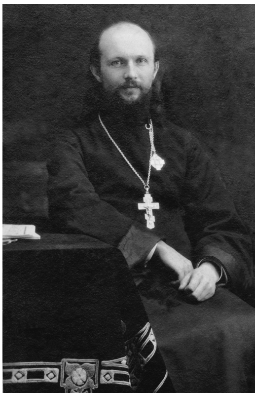
Священник Михаил Околович. 1917 год

Епархия переживала тяжелое время, так как церковную власть при поддержке безбожных властей пытались захватить обновленцы, и отец Михаил решением духовенства Иркутской епархии был направлен в Москву к Патриарху Тихону. Он поставил в известность Патриарха о положении дел в епархии во время отсутствия на кафедре православного архиерея и выразил Святейшему твердое суждение иркутского православного духовенства и паствы, что с обновленцами, как с предателями веры, не следует вступать ни в какие переговоры.