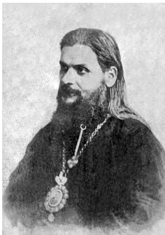
Гермоген, епископ Саратовский и Царицынский

им столовых духовно-просветительского отдела Братства Святого Креста. Как богослужения церковные, так и внебогослужebные собеседования всегда оканчивались раздачей народу листов и брошюр религиозно-нравственного содержания. Печатному слову епископ придавал особое значение в борьбе с врагами Церкви. В противовес литературе отрицательной, безбожной, противцерковной, в миллионах экземплярах брошюр и листов распространяемой среди народа врагами Церкви и государства, владыка раздавал литературу положительную и обличительную. С этой целью он преобразовал и расширил епархиальный печатный орган – «Саратовский духовный вестник» и учредил еженедельный «Братский листок»; еженедельные печатные издания по его благословию и при его поддержке появились в Балашове, Камышине и Царицыне.