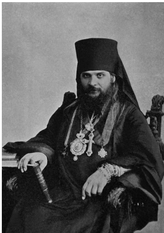
Епископ Гермоген (Долганев). 1904 год

и праздничных дней, владыка служил вечером по средам и пятницам. Во многих саратовских храмах Преосвященным Гермогеном было введено общенародное пение. В особо исключительных и важных случаях общественной и государственной жизни России владыка устраивал в Саратове и уездных городах и многонаселенных поселках ночные службы – с крестными ходами по городу и селениям, общим пением всех молящихся и поучениями проповедников. Для соблюдения порядка в крестных ходах им было учреждено при кафедральном соборе общество хоругвеносцев.