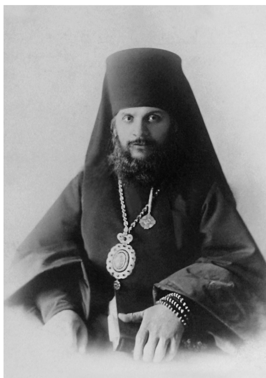
Гермоген, епископ Вольский, викарий Саратовской епархии

При вручении епископу Гермогену архиерейского жезла митрополит Антоний сказал: «Возлюбленный о Господе брат, Преосвященный епископ Гермоген! Размышляя о вступлении нашем в новый, XX век по Рождестве Христовом, новостию своею обозначающий постоянное течение времени, смену дней и годов и человеческих поколений, и вникая в то же время во внутренний смысл епископской хиротонии, ныне над тобою сонмом святителей совершенной, мы невольно мыслю своею останавливаемся на сочетании в жизни и истории начал временного и вечного, изменяемого и неизменного. Движение веков и поколений, могущество и честь, слава и богатство человеческие суть явления изменчивые, они приходят и уходят, а Бог и Его воля, Его уставы и повеления неизменны, они пребывают во веки... Времена идут и сменяются, а Богом установленные основы церковного строя и жизни остаются неизменными. В этом неизменном начале Божиих глаголов и повелений и заключается высший разум жизни, без которого она была бы бессмысленна и ничтожна...»