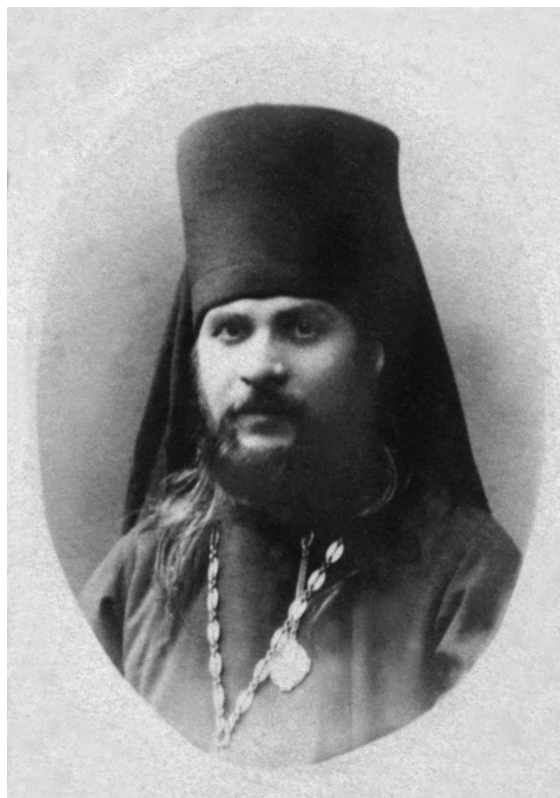
Игумен Гермоген (Долганев)

Окончив Духовную академию, иеромонах Гермоген 17 сентября 1893 года был назначен инспектором Тифлисской Духовной семинарии. Характеризуя его на этой должности исключительно как монаха, готового жертвовать всем ради ближнего, ректор семинарии архимандрит Серафим (Мещеряков) 2 , не сочувствовавший чисто монашескому и глубоко христианскому образу жизни иеромонаха Гермогена, писал: «Будучи инспектором, он помещал в своей квартире то преподавателей, то учеников, а сам жил в одной из двух комнат...»