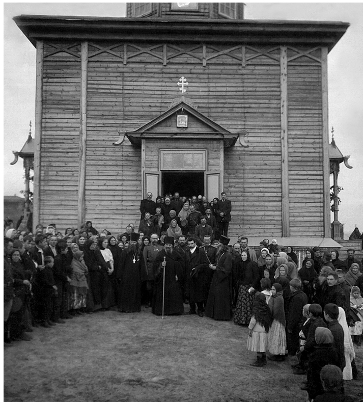
После освящения церкви в Саратове

отягощенные житейскими невзгодами и нуждами люди... За исключением города Камышина все города Саратовской епархии, благодаря трудам и деятельному участию и поддержке – не только нравственной, но и материальной со стороны Преосвященного владыки Гермогена, имеют или будут иметь свои обители или подворья, каковые уже и теперь доставляют утешение, отраду, духовное успокоение и спасение верующему и благочестивому народу русскому...»