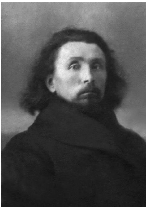
Диакон Григорий Самарин

Священномученик Григорий родился 9 января 1893 года в селе Салмановка Наровчатовского уезда Пензенской губернии в семье крестьянина Василия Самарина. В 1914 году после окончания Пензенского духовного училища он был назначен псаломщиком в церковь в честь святого Архистратига Михаила, причт которой духовно окормлял военнослужащих 11-го Туркестанского стрелкового полка в городе Керки Закаспийской области. В 1914 году началась Первая мировая война, и Григорий был призван в армию и служил до 1918 года рядовым. В 1919 году он был назначен псаломщиком в Покровскую церковь села Высокое Чимкентского уезда Сыр-Дарьинской области и 9 февраля 1920 года рукоположен во диакона. 27 сентября 1922 года он был назначен диаконом к Иосифо-Георгиевской церкви в городе Ташкенте. С 3 августа 1923 года диакон Григорий стал служить в храме Архангела Михаила в родном селе Салмановка; 9 мая 1925 года он был переведен в Вознесенскую церковь в город Спасск Пензенской губернии.