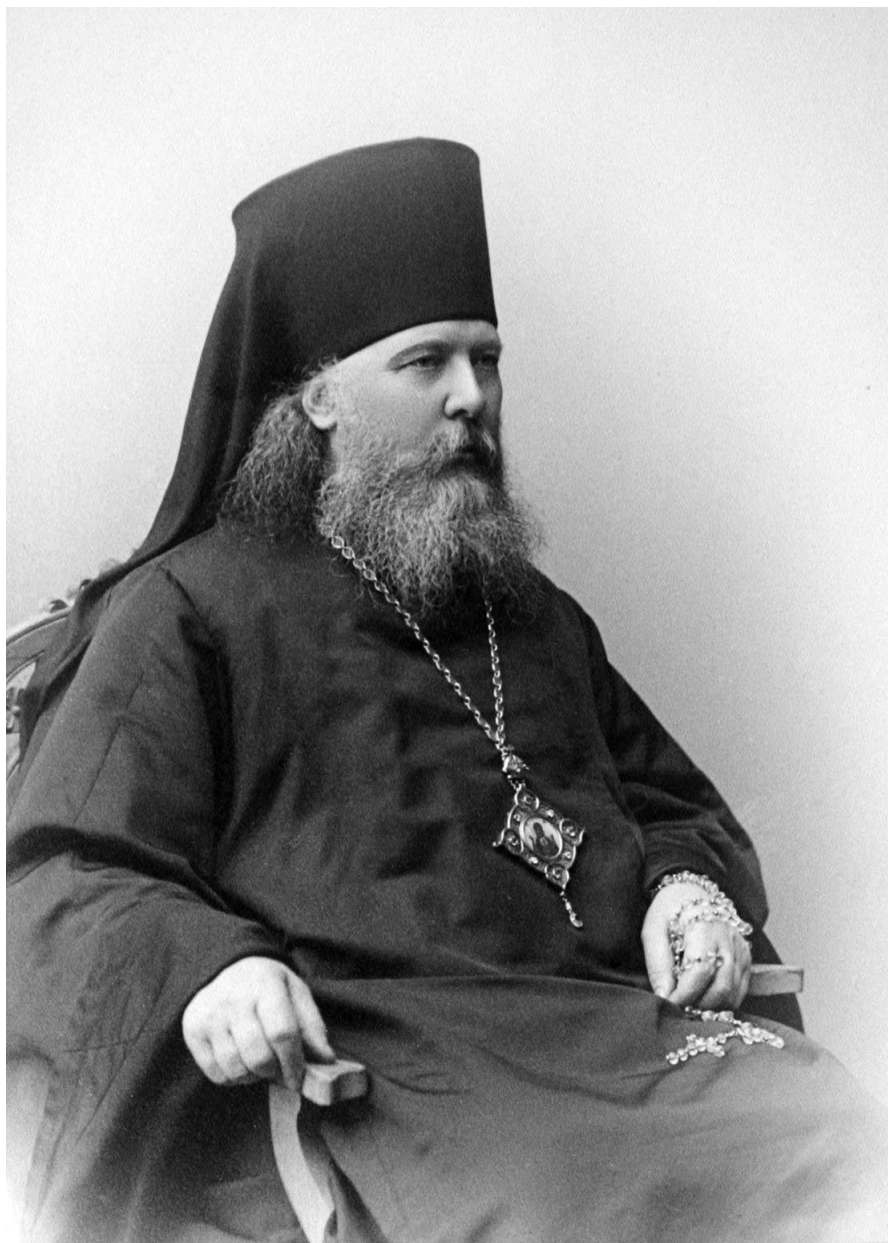
Епископ Антоний (Быстров)

активно разъяснял обществу существо происходивших событий и в 1908 году «за особо ревностные труды по умиротворению населения и упрочению законного порядка» был награжден орденом Святой Анны 2-й степени.