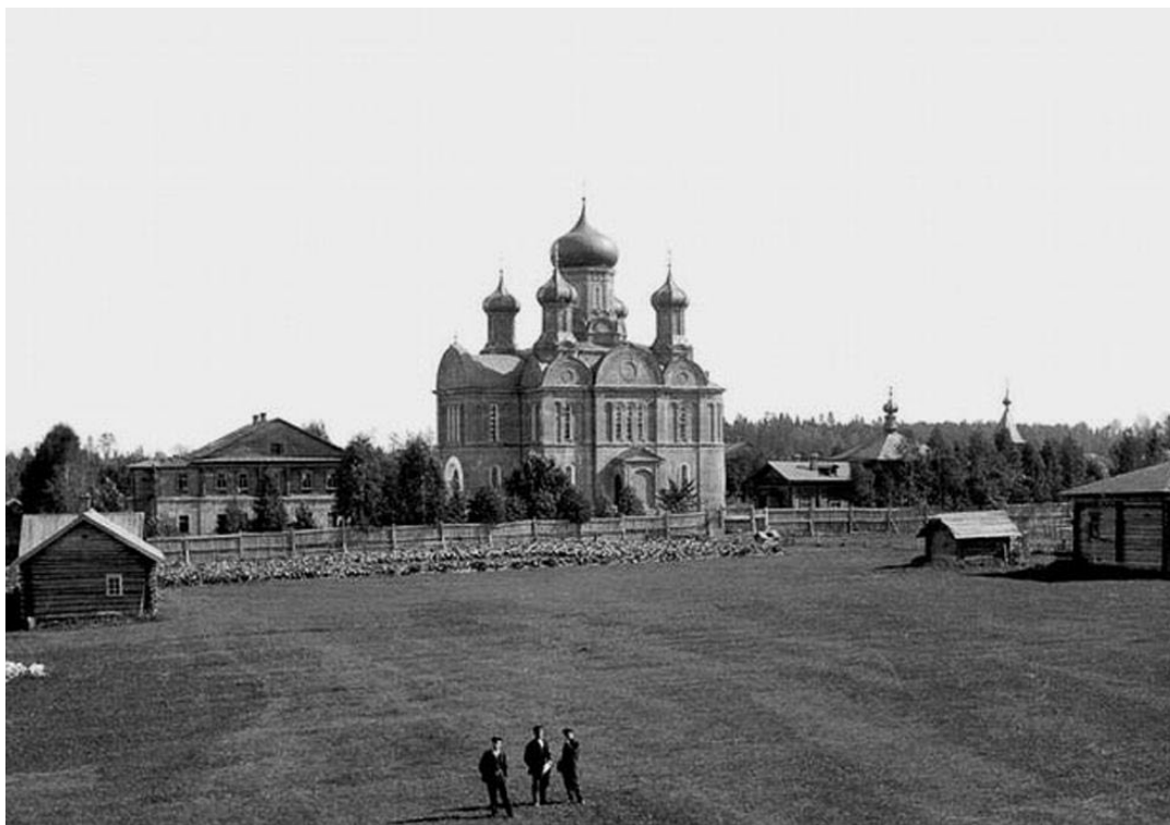
Спасо-Преображенский Севастиановский монастырь