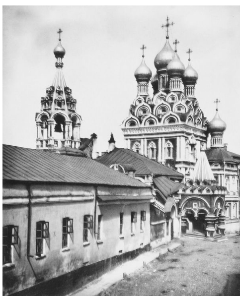
Церковь в честь Троицы Живоначальной в Никитниках