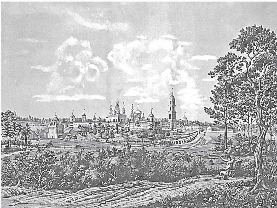
Вид Саровской Успенской пустыни с северо-западной стороны. 1853 год

«Засохшие комья земли больно отбивают подошвы ног, – писал он. – Рядом с проезжей дорогой вьется узкая тропинка, иногда пропадая в начинающей уже желтеть ржи и в высоких сочных овсах. Далеко позади белеет Арзамас. А впереди – поля и холмы; и чудится мне, что эти поля должны кончиться за ближайшим холмом, и тогда откроется совсем другой мир. Какой? Я и сам не знаю, только представляется он мне глубоко отличным от того, который остался позади. Но вот дорога поднимается на холм, открываются новые дали, а „другого мира“ все еще нет.