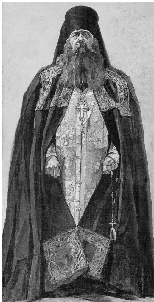
Архимандрит Никита (Куручкин). Портрет к картине «Русь уходящая». Худ. П.Д. Корин. 1936 год

Отец Феодор, однако, оставался благожелательно настроен ко всем членам общины, вовсе и не собираясь разрывать отношений только потому, что принял монашество. Пасху в 1932 году члены общины предложили ему отпраздновать вместе.