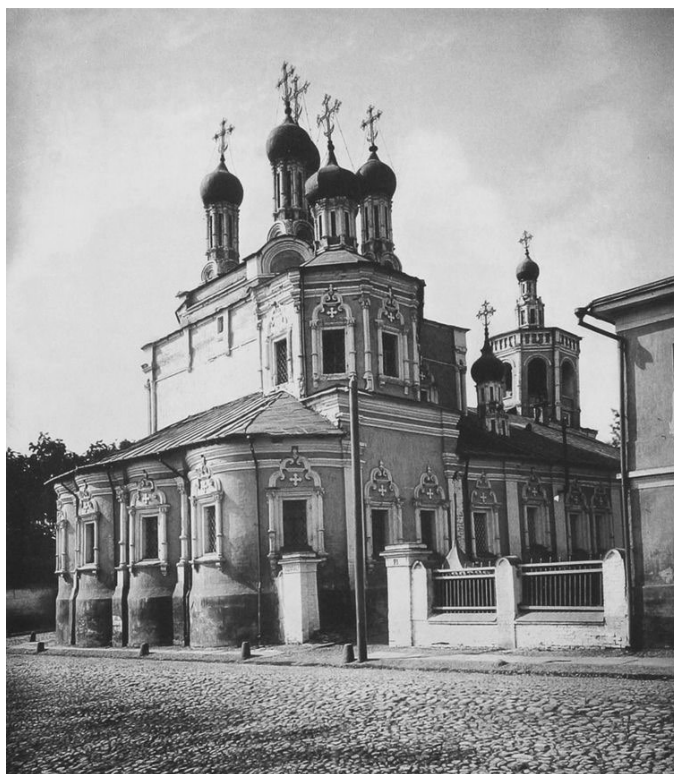
Церковь во имя преподобного Сергия Радонежского на Большой Дмитровке