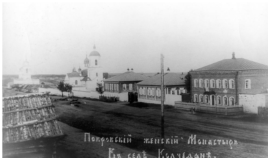
Колчеданский Покровский монастырь