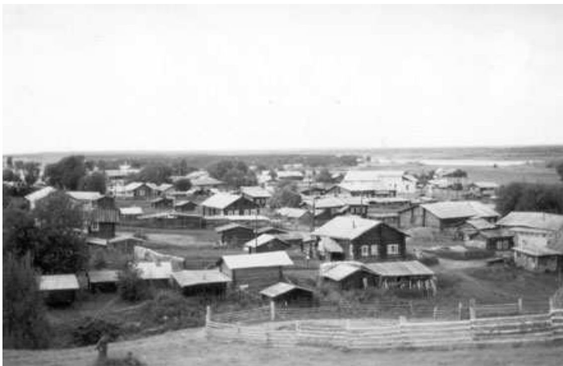
Село Керчёмья Коми области

хозяйства. Всю свою жизнь в нашем приходе он отдавал всего себя народу, борясь с грубостью, невежеством, темнотой, пьянством и хулиганством. Он не занимался какой-либо провокацией и пропагандой против советской власти, не выступал ни на каком собрании. Он никогда не был врагом народа, а был всегда другом его, полезным и ценным членом общества, а посему мы, прихожане села Власьево и граждане селений Пасынкова, Никифоровской, Перемерок, Иенева, Кольцова, ходатайствуем перед ОГПУ о его освобождении».