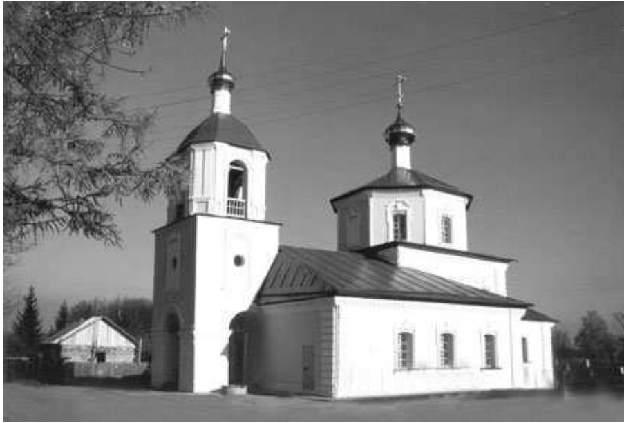
Храм Казанской иконы Божией Матери. Село Власьево

Общество находится под наблюдением и руководством местного священника.