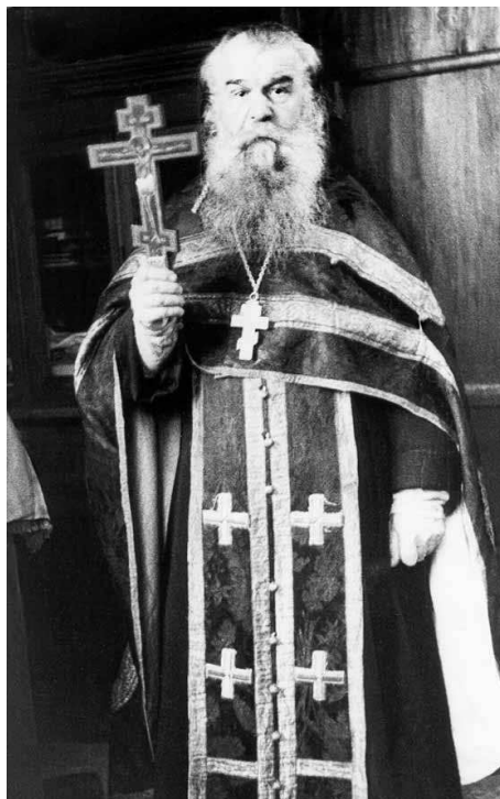
Протоиерей Иоанн Бороздин

рукоположен в сан диакона ко храму Всехсвятского единоверческого монастыря. Здесь он прослужил до его закрытия в 1921 году.