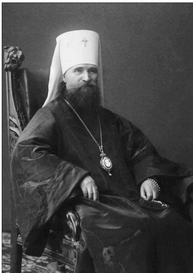
Митрополит Санкт-Петербургский Владимир

разрешения тема. Но переговорить с Императором лично – в этом митрополит видел свой долг, он не считал возможным для себя продолжать молчать. При встрече с Императором митрополит Владимир стал говорить о Распутине, и прежде всего о том, насколько губительно его вмешательство в церковные дела. Император, выслушав владыку, сказал, что, может быть, он во многих отношениях и прав, но Императрица никогда не согласится на изменение положения дел в этом вопросе.