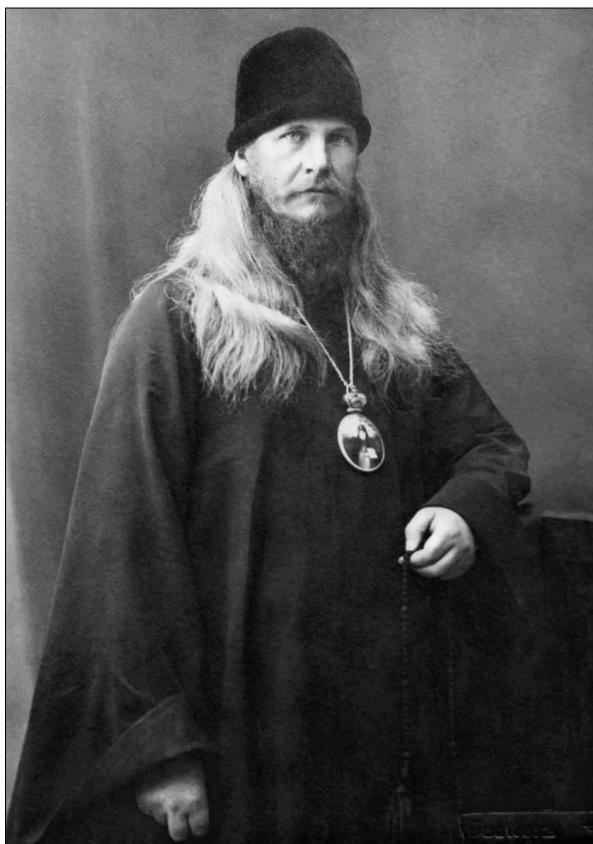
Архиепископ Воронежский Петр. 1926 год

признают, дела с ним не имели и не желают иметь. Они, как представители рабоче-крестьянской власти, считаются только с волей рабочих и представителей верующих.