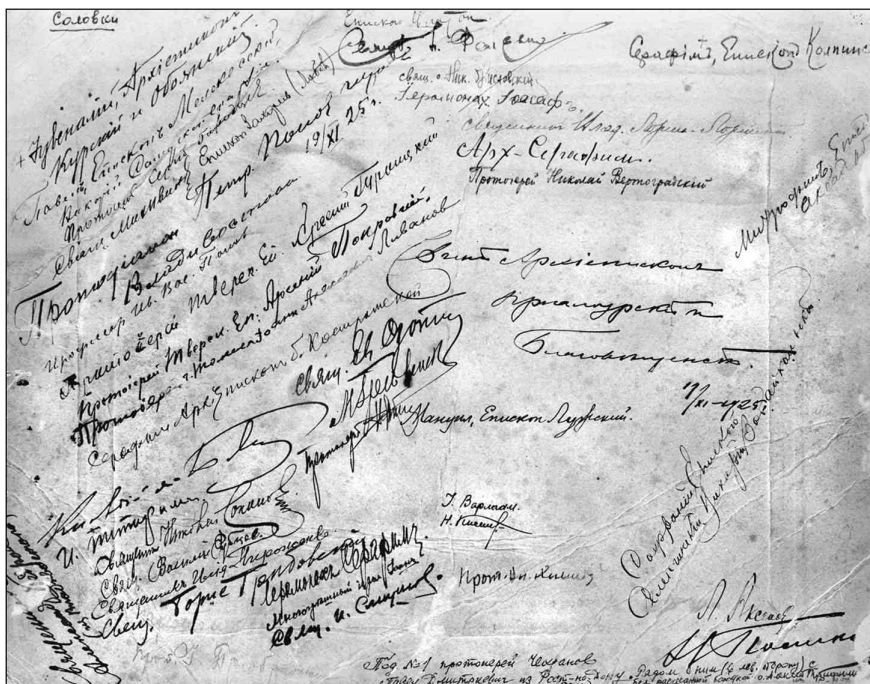
Оборот фотографии с факсимиле подписи узников